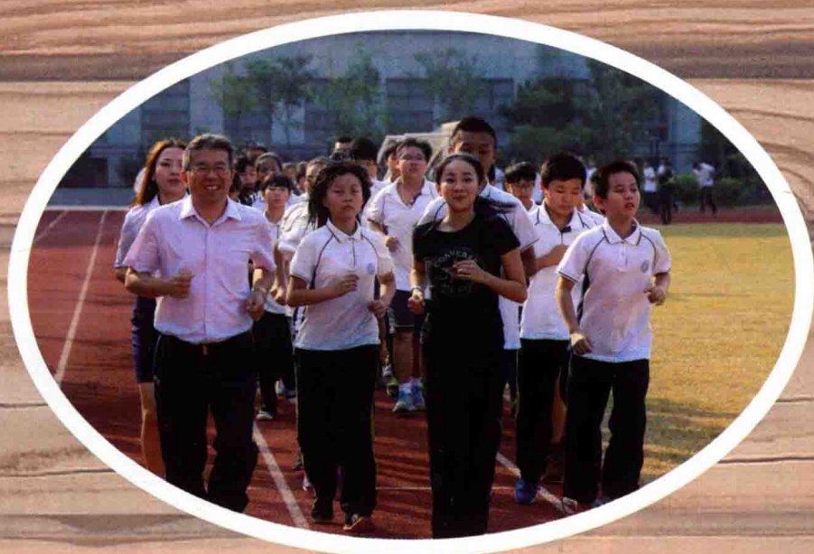
在明德带着学生跑步