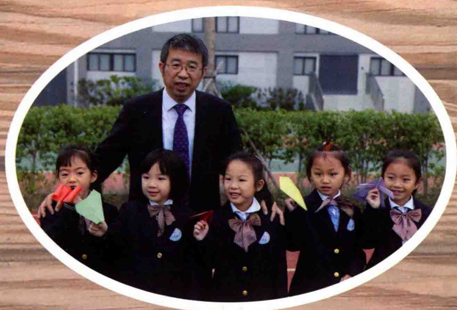
在明德和孩子们在一起