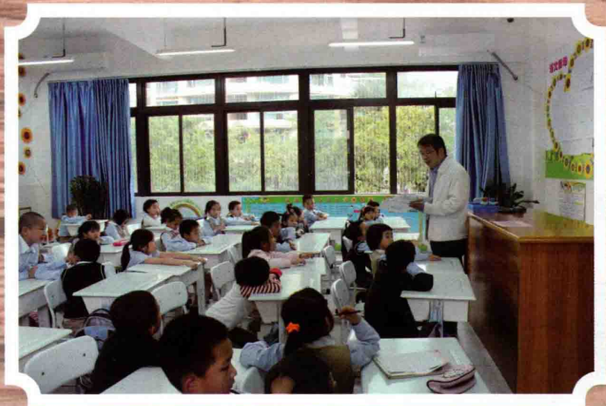
为一年级四班的孩子们讲绘本