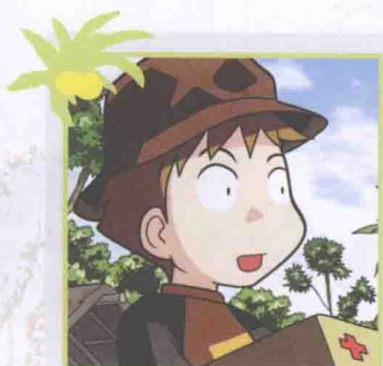
黄光熙 · 偶像歌手

韩国丛林偶像代表，虽然有些幼稚和娇气， 但知错能改，又活泼开朗，是炳万族的吉祥物。