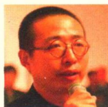
潘鲁生 中国设计艺术院院长