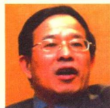
范以锦 (报纸设计类评委会主任) 暨南大学新闻与传播学院院长 教授、博士生导师