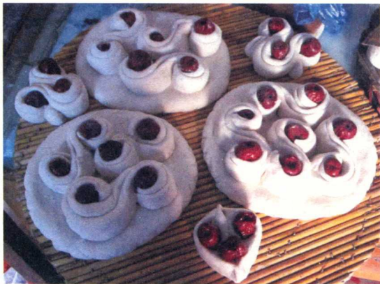
▲ 蒸好的大花糕/魏小魁 摄/2011年

用白面和红枣蒸出来的可以一层一层堆叠起来摞很高的像小山一样的馒头，一般在祭祀神明、祭祀祖先的时候使用，祭祀过后可以用来招待家宴中来访的亲戚、客人。枣山的制作过程比较复杂，要先制作一张较大的圆形面皮做底，约1厘米厚；再揉一条细长的圆柱形面块儿，用筷子在上面压一条