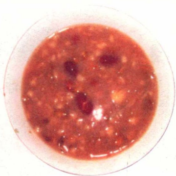
▲ 腊八粥/2011年

按照浚县的民间习俗，人们在腊月初八这一天要喝腊八粥。腊八粥基本上是用豇豆、红枣、绿豆、大米、红薯、江米、花生、小米这八种传统原料熬制的。过去都是自己配置，现在一些商场为了方便顾客，提前将这八种原料混合包装好，顾客买回去可以直接熬制。今天人们熬制腊八粥已经不局限这八种原料了，群众会根据自己的喜好，尽量多地添加营养丰富的杂粮和干果，比如耿华民家的腊八粥就加入