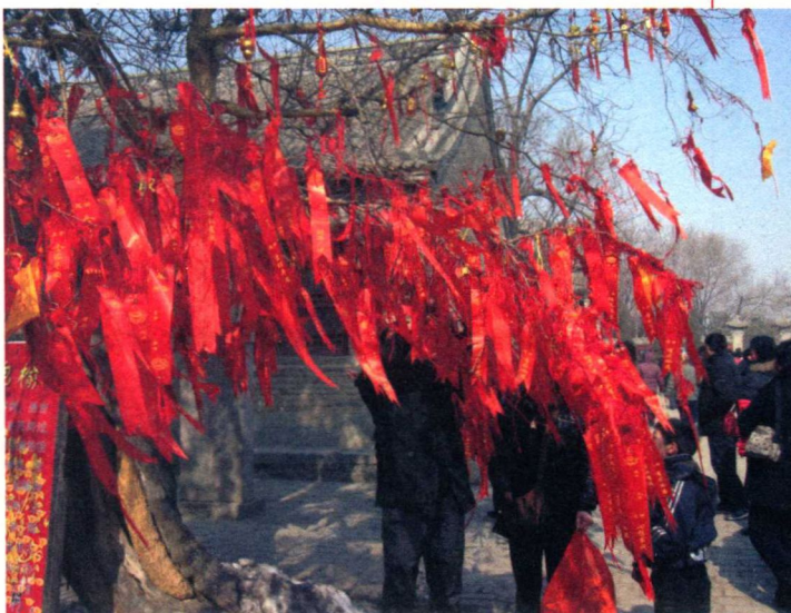
▲ 榆抱槐祈福树/2011年

正月初五，也称“破五”，浚县民间认为，正月初一至初五是岁首，禁忌有很多，初五过后，禁忌解除，人们可以正常劳作，故称之为“破五”。如春节期间忌用剪刀，破五后始可做针线。过去，“初五五更，人们把煤灰、垃圾送至村外路口，烧香叩头，谓之‘送五穷’，意即送走穷神，渴望富裕。