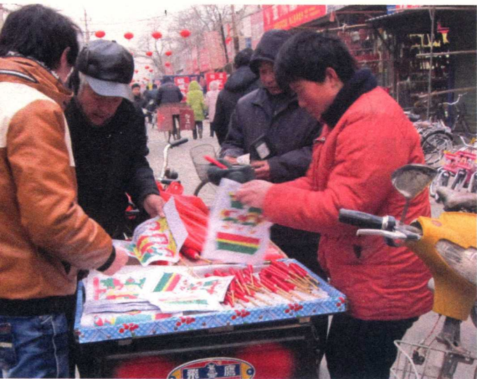
▲ 腊月二十三下午群众买灶王神像和祭灶蜡/2011年

先的一切牌位都只能说“请回家”和“服侍到墙上”，而不允许说“买回家”和“张贴到墙上”。所以，灶王的画像不能说“买”，只能说“请”。