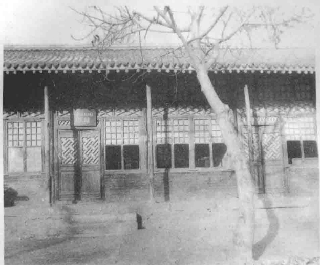
毛主席对《晋绥日报》编辑人员谈话旧址。