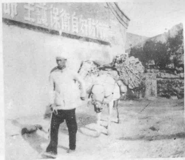
《晋绥日报》运往各地。