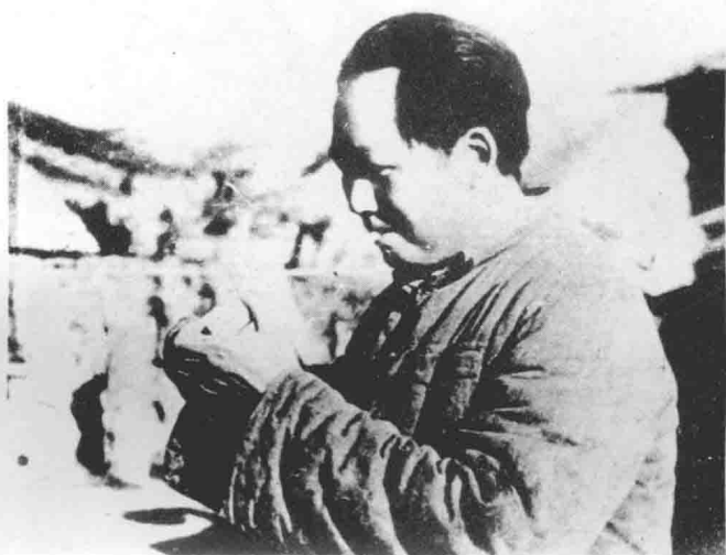
毛泽东同志在兴县蔡家崖。