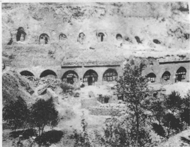
《抗战日报》社所在地—陕北神府杨家沟。