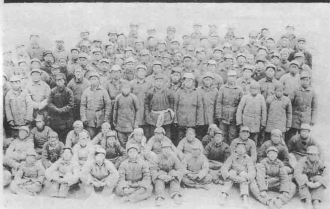
晋绥日报造纸厂全体职工。