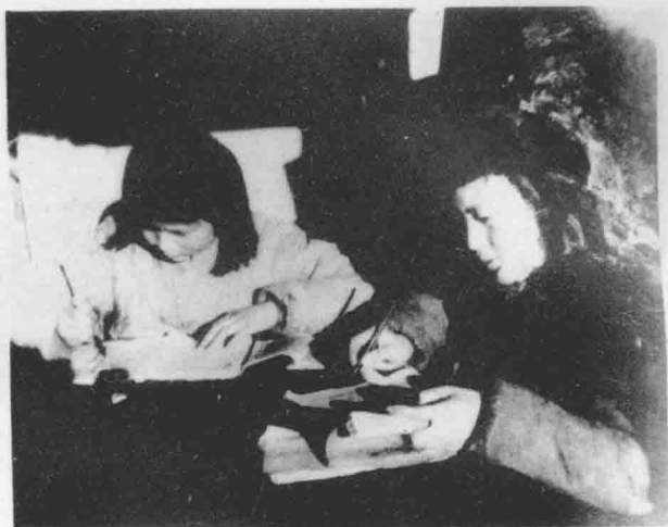
译电员在译新华社消息。