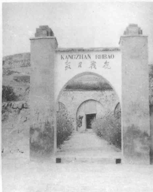
《抗战日报》社旧址兴县高家村。