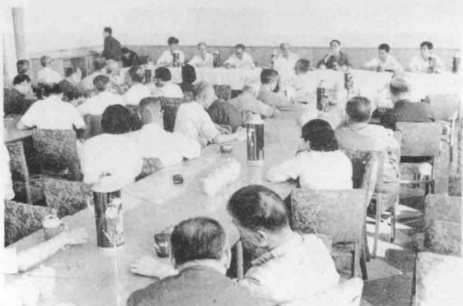
《晋绥日报》报史座谈会于1984年7月5日在太原召开，图为7月13日在大同举行闭幕式。