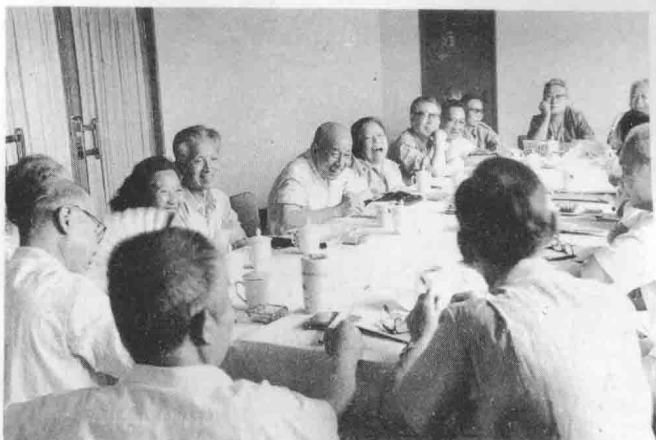
《晋绥日报》报史座谈会在分组讨论。