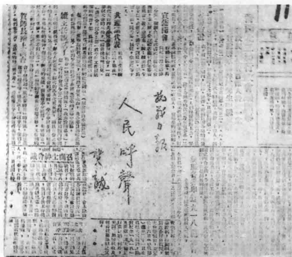
贺龙同志为《抗战日报》创刊题词。