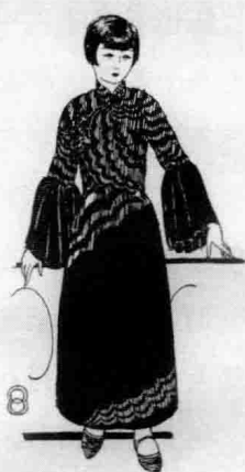
中年婦女新裝束 葉淺予作

20世纪20年代，由于职业女性的涌现，少女便装偏于实用舒适，风格为条纹、宽袖、小立领、褶裥裙，中年女性连衣裙，上身裁剪凸显女性线条，长裙为宽松直筒，云纹、小袖、小立领。这是叶浅予1928年在《良友画报》所创作的女子装束，今日看来，依旧时尚万分。