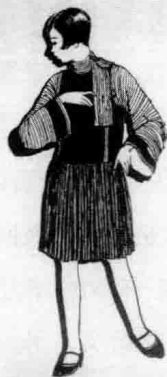
少女應用之便裝 葉淺予作