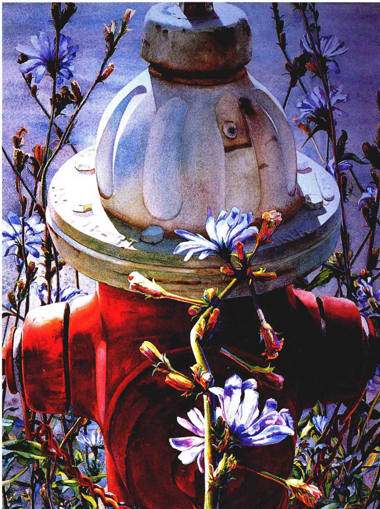
菊苣和消火栓 Mary Lou Ferbert 34×26.5 英寸