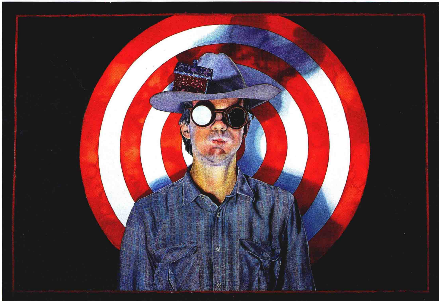
不情愿分得土地的定居移民