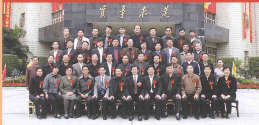
中共龙岩市委党校 第三期二年制大专培训班学员于建校五十周年合影 2006.12.9