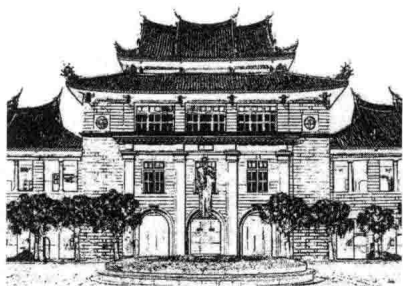
My Teachers of Xiamen University