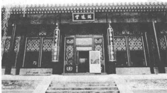
图 1-2-1 北京颐和园中谐趣园的楹联“西岭烟霞生袖底，东洲云海落尊前”

一座优秀的园林，之所以能吸引无数游人百看不厌，风景秀美是重要原因，但这并不是全部，其中文化与历史的因素也至关重要。在中国，无论是雅致的城市宅园，或是深山古刹，还是风景名胜，随处可见雕刻于山石、悬挂于亭台楼阁的匾额、楹联，也随处可见写景咏物的诗词文赋。如“山山水水，处处明明秀秀；晴晴雨雨，时时好好奇奇”，这是杭州西湖中山公园里的一副对联，它以浓墨重笔写出了轻快蕴藉的辞境。书法真、草相间多变，与西湖山色空濛的景致水乳交融，相得益彰，给游人以古典文化的熏陶，同时也大大地深化了园林景观的意境。