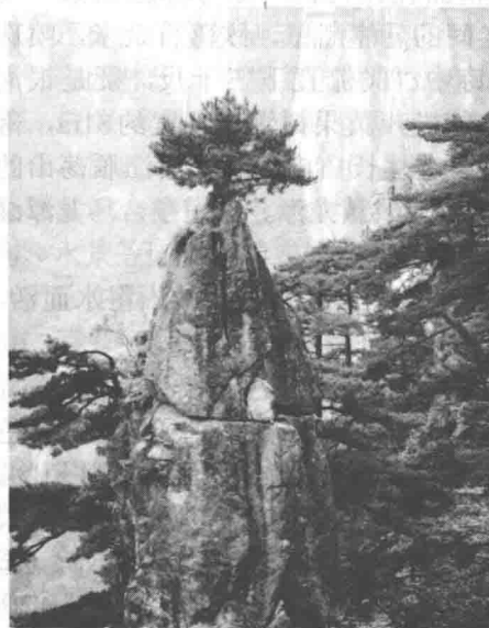
图1-1-1 黄山的梦笔生花

山岳景观在总体构成上显示比例、主从、均衡、节奏、层次、虚实等形式美的规律，体现多样性与统一性的辩证关系。