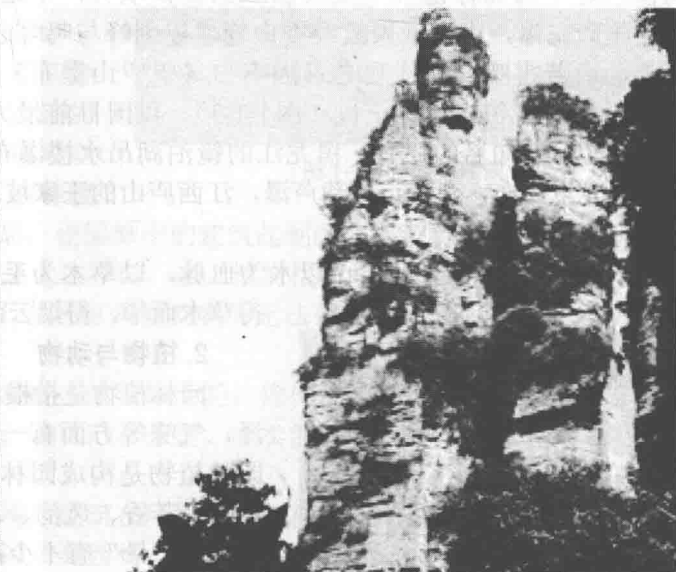
图1-1-2 张家界的夫妻岩

水是园林中的“血液”和“灵魂”，给人以明净、清澈、近人、开怀的感受。宋朝的郭熙、郭思在《林泉高致·山水训》中有这样一段对水的描写：“水，活物也，其形欲深静、欲柔滑、欲汪洋、欲回环、欲肥腻、欲喷薄、欲激射、欲多泉、欲远流、欲瀑布插天、欲溅扑入池，欲渔钓恰恰、欲草木欣欣、欲挟烟而秀媚、欲照溪谷而光辉，此水之活体也”。堪称对水体绝妙的刻画。