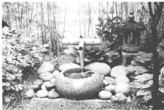
图 1-1-5 园林小品

广场与道路、建筑的有机组织,对于园林形式的形成起着决定性的作用,不论是规则的或自然的,还是混合的园林形式。