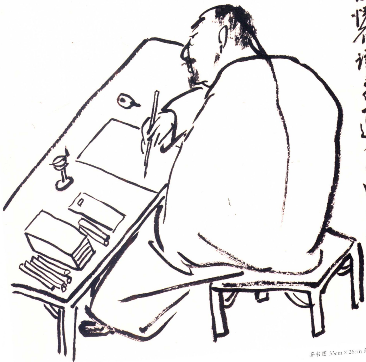
著書圖 33cm×26cm 紙本墨筆 2008年