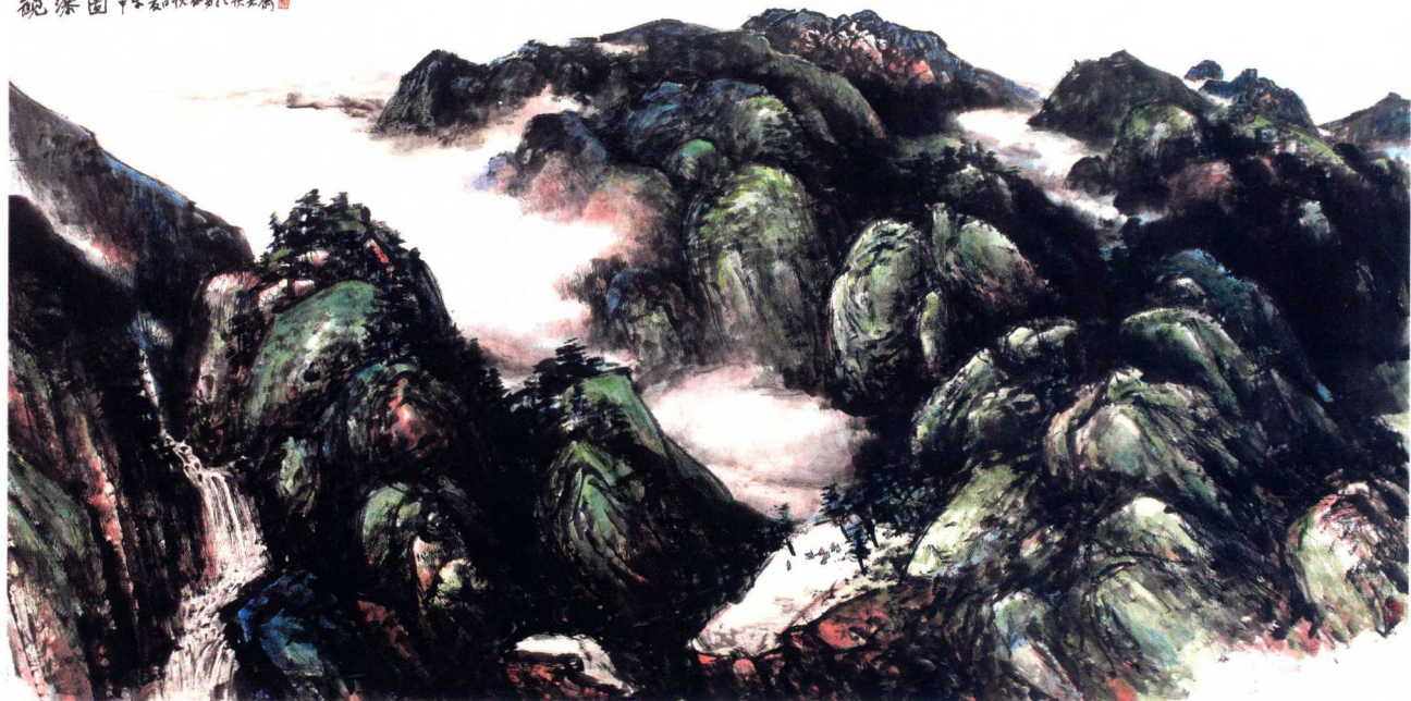
观瀑图 120×240 纸本设色 2014