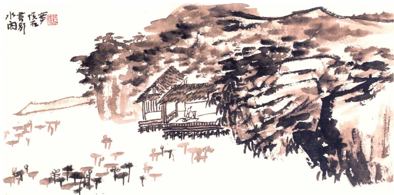
水閣書聲 16×32cm 紙本墨筆

缺漏，精研画理画法之外，结合自身实践，又录记大量心得体会，其文辞灿然，文章尤好。他深知“悟后便得是处”的道理，认为：“文以载道，画以辅道，大义微言，在识者之心胸。一画既成，本性如镜，万法如一，在识者明鉴。百年一瞬，过客如云，喧哗与寂寞唯余叹息。”“文章与绘事以风骨为重，以笔墨生发为本，万千变化，神鬼莫测，古往今来之大国手莫不如是……”并激励自我：“……今日之画学，方兴未艾，道路多歧，待吾辈努力不辍”，“体认之、领悟之、笃行之”，“余知其艰难，侧身其间，随其俯仰。”