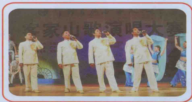
革命山歌《风吹竹叶》参加 “首届中国客家文化节”并获金奖