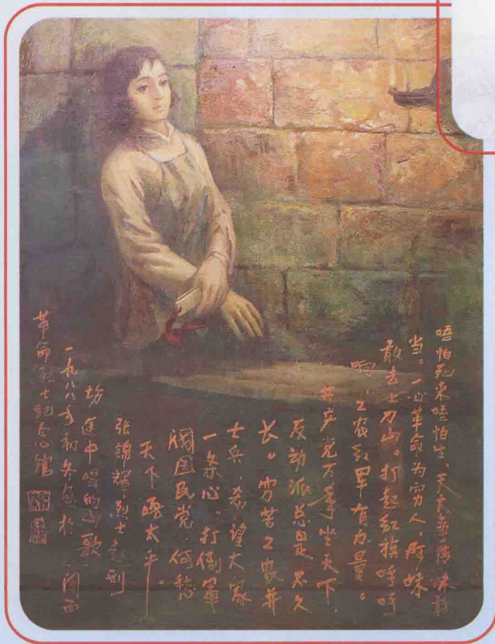
唱着革命山歌就义的“红色小歌仙”张锦辉