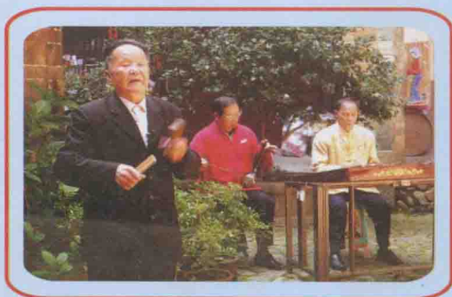
“山歌大王”李天生演唱竹板歌