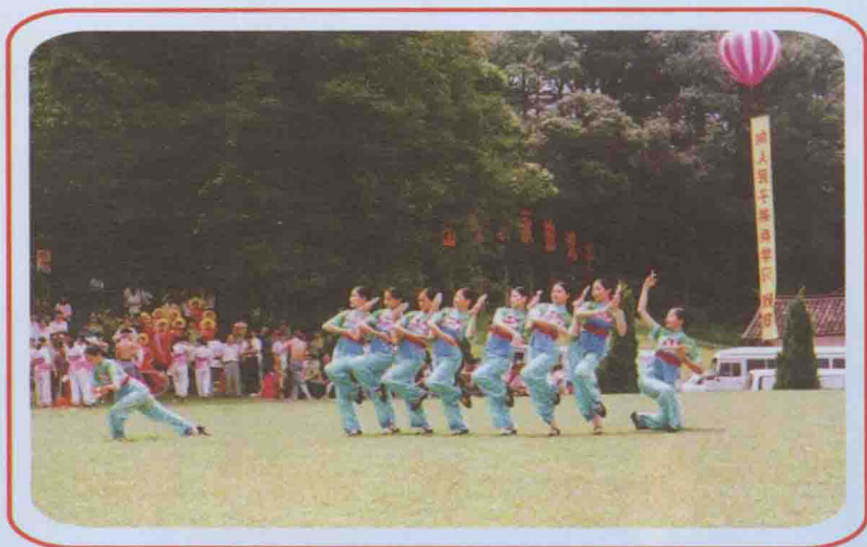
歌舞《双双草鞋送红军》