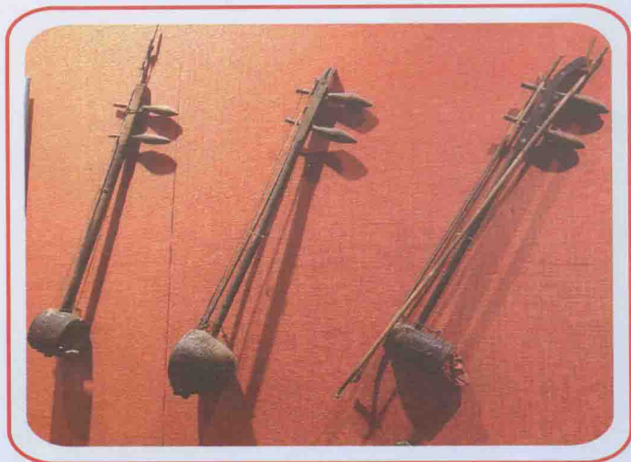
革命战争时期用过的乐器