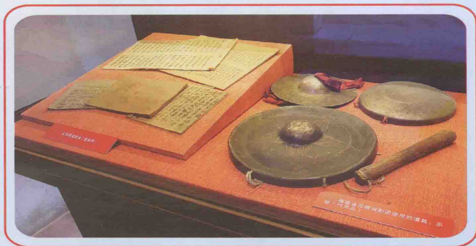
革命战争时期用过的锣钹和歌册