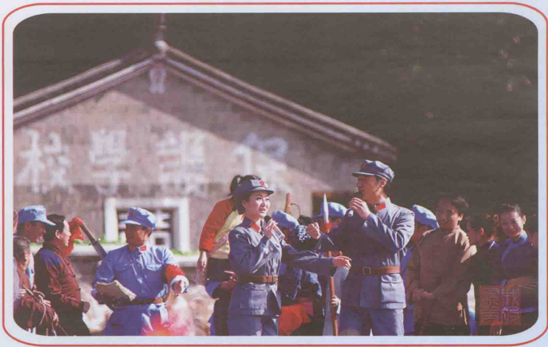
中央电视台“心连心”艺术团在古田演唱闽西革命历史歌曲