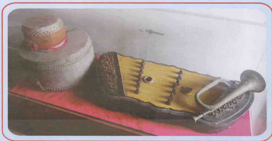
革命战争时期用过的乐器