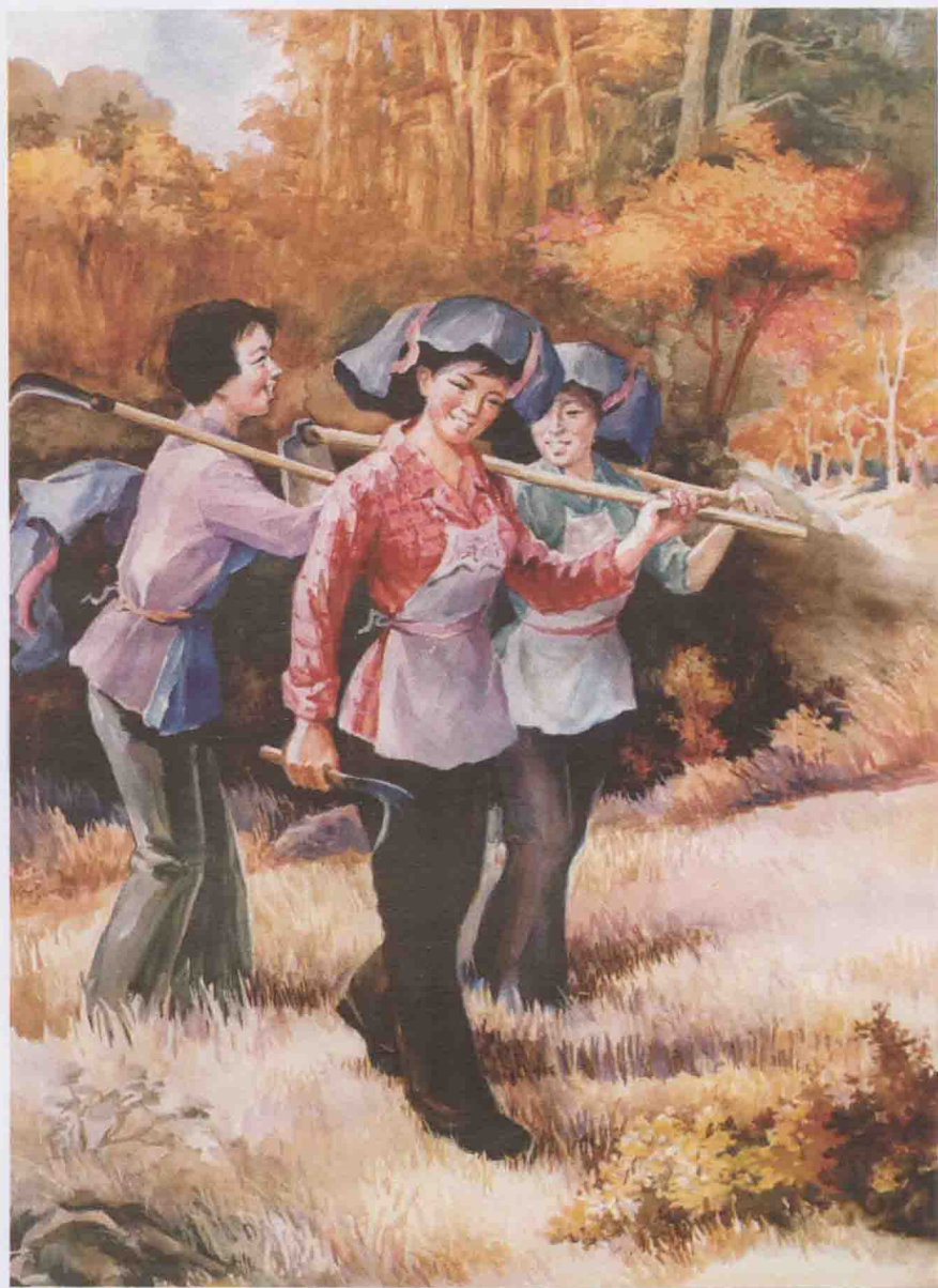
廖春贺画《当年苏区客家女》