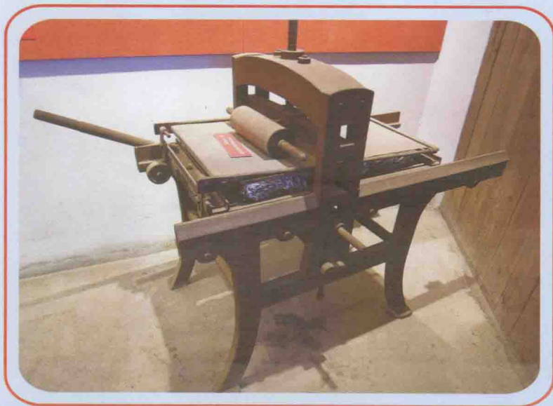
革命战争时期印歌册用的石印机