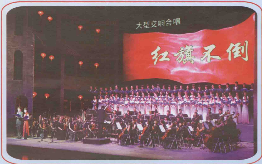
2013年9月27日龙岩市在省“福建大剧院”演出大型交响合唱《红旗不倒》