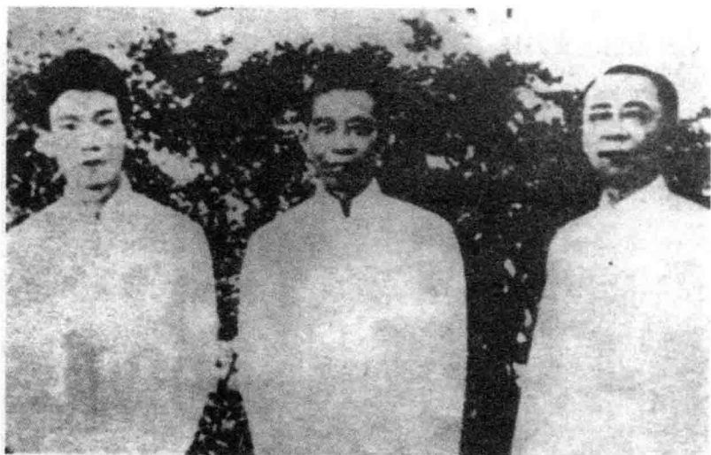
郁达夫与其兄长曼陀、二兄养吾合影