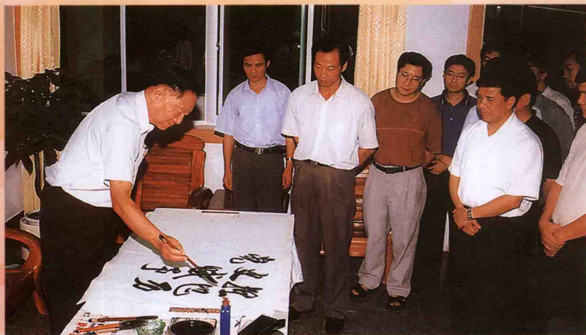
2002年9月，时任中共中央委员、中央党校原常务副校长郑必坚，在时任中共龙岩市委书记、现任中共福建省委常委、统战部长张燮飞和中共龙岩市委副书记、市委党校校长林仁芳陪同下来我校视察并题词