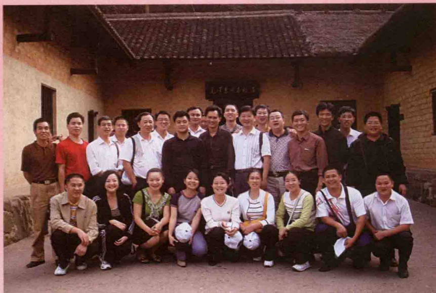
2006年，第4期青干班学员到湖南韶山瞻仰毛主席故居