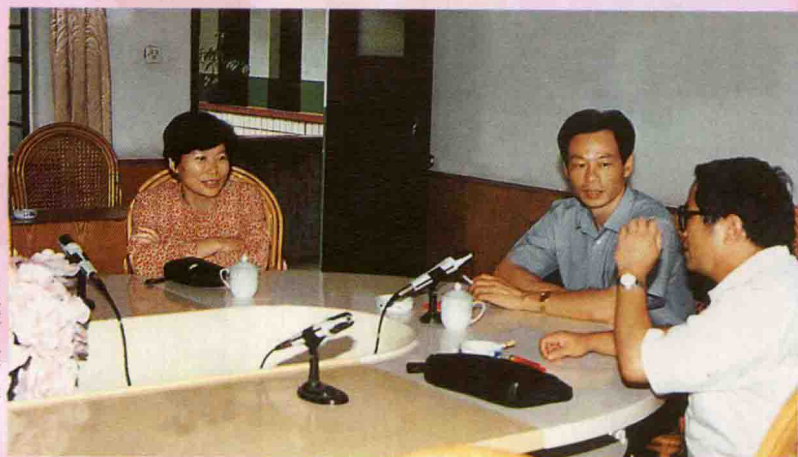
1998年，时任中共龙岩市委书记、现任中共福建省委常委、统战部长张燮飞，时任中共龙岩市委副书记、现任全国妇联副主席、党组副书记、书记处书记陈秀榕来党校调研