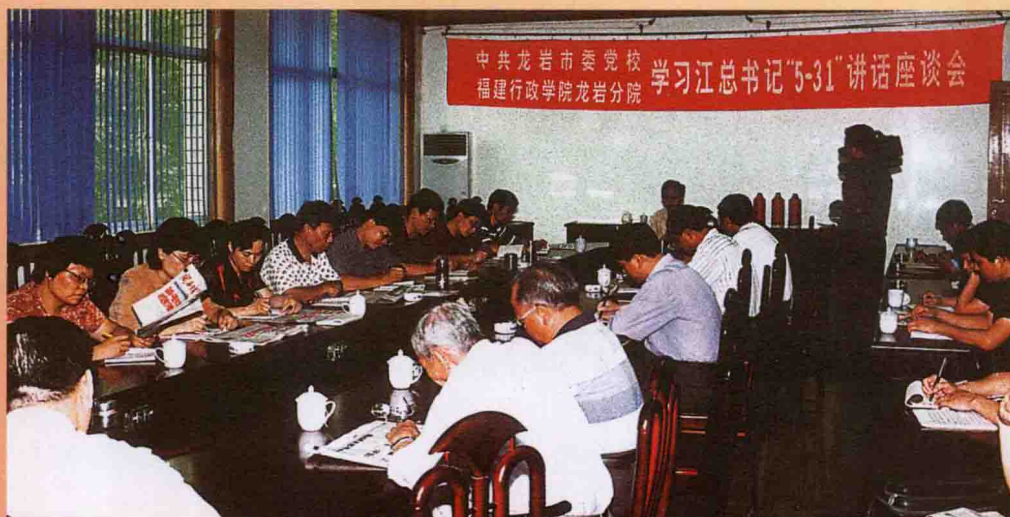
2002年6月，校委理论学习中心组举行学习座谈会