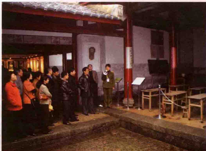
2005年4月，校机关党委组织全体党员到古田接受革命传统教育