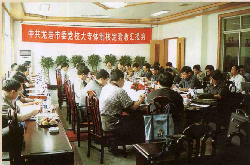
2004年6月，福建省设区市委党校大专体制核定验收组来我校核定验收