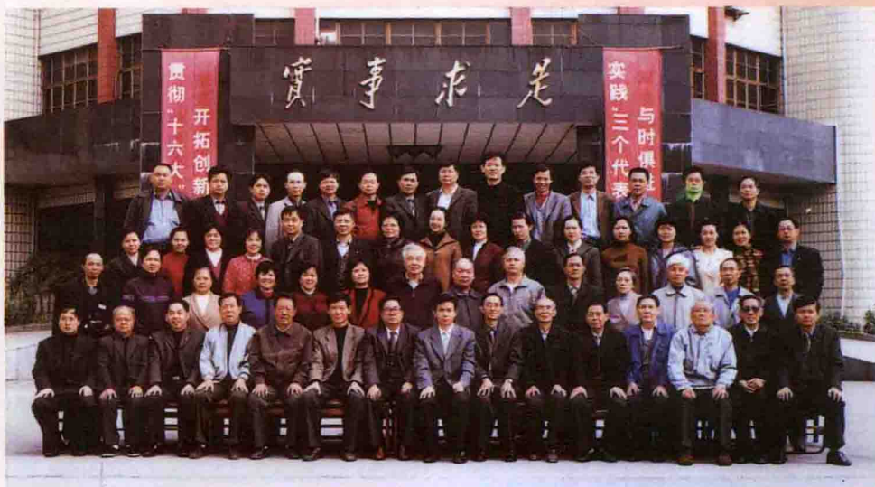
2002年12月，校机关党委成立，全体党员合影