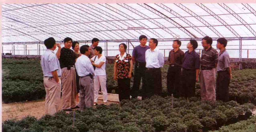
2002年5月，中青班学员到漳平市永福镇调研