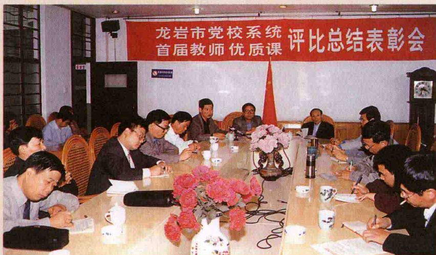
1999年11月，全市党校系统优质课评比活动