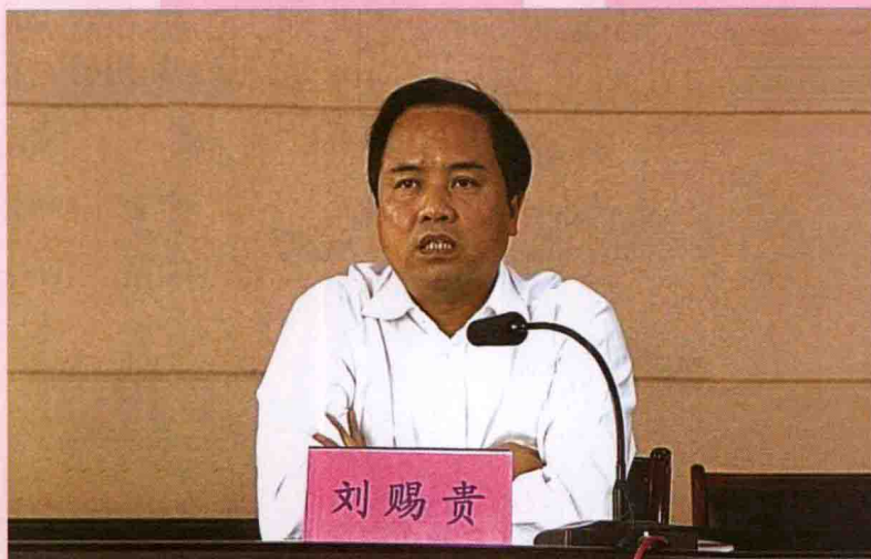
2006年11月，中共龙岩市委书记刘赐贵来党校为主体班学员讲课