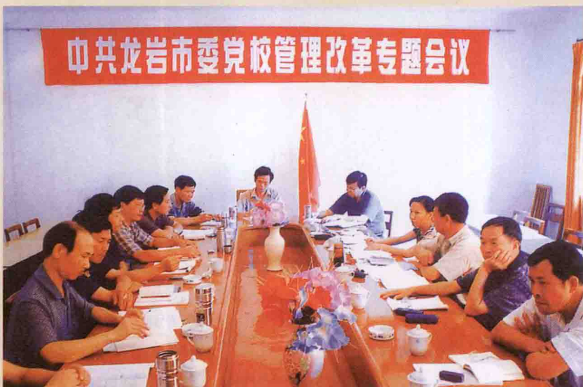
2004年7月，校管理改革专题会议上杭古田镇召开