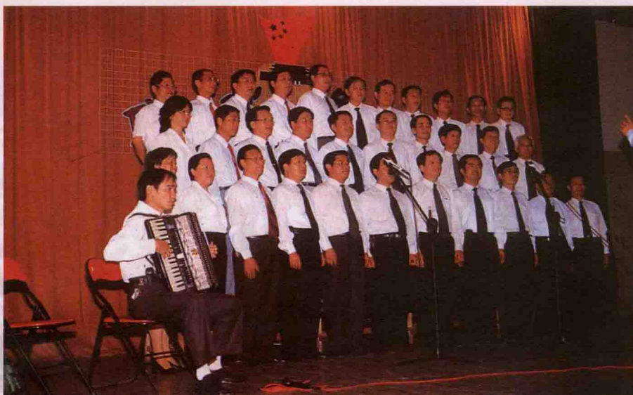
主体班学员开展丰富多彩的文艺活动