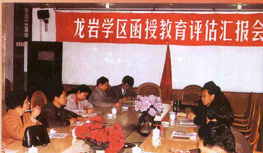
1998年，龙岩函授学区接受中央党校函授教育评估