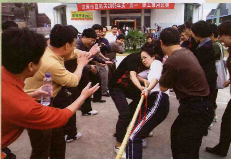
2005年，女教工参加龙岩市直机关庆“五一”职工拔河比赛