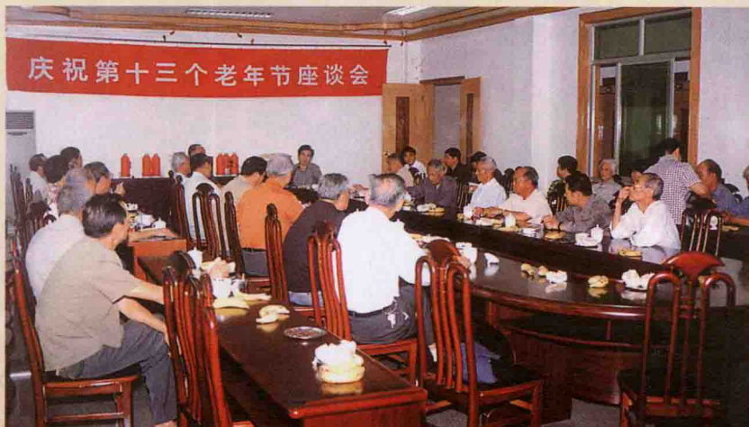
2003年10月，举行老同志座谈会，庆贺老年节