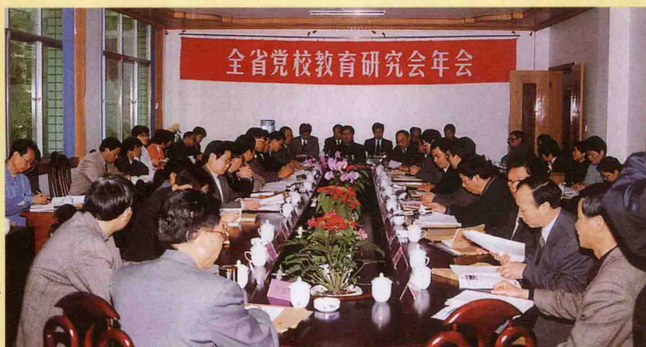
2001年元月，全省党校教育研究会在我校召开