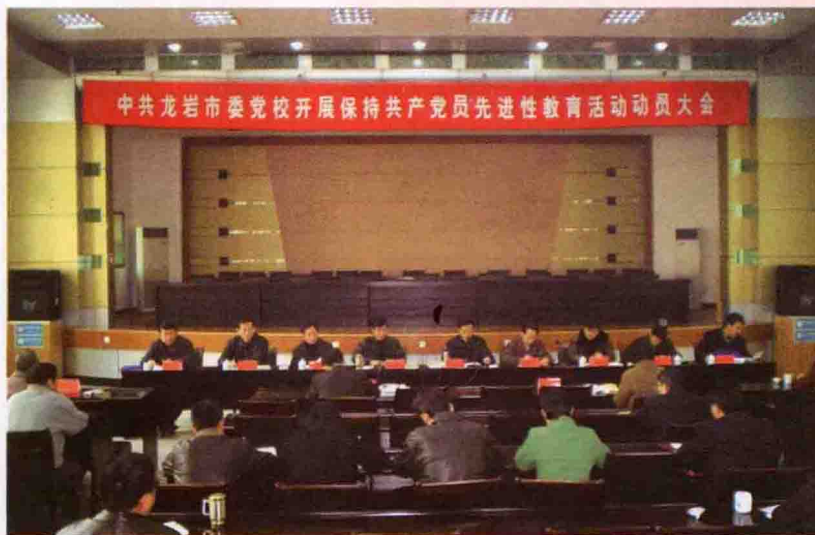
2005年2月—6月，开展保持共产党员先进性教育活动