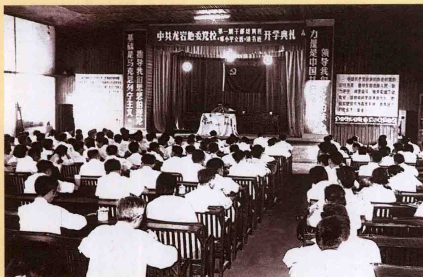
1983年9月，地委党校第一期干部培训班暨《邓小平文选》读书班开学典礼