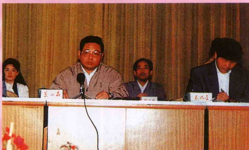
1993年3月，时任中共龙岩地委书记、现任福建省省长黄小晶来我校为学员作报告