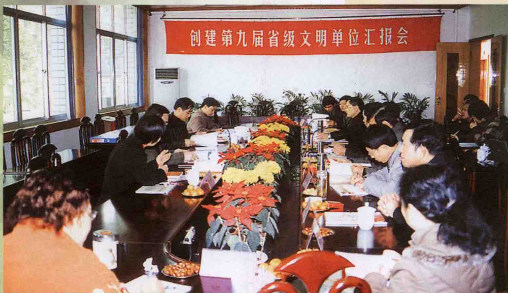
2005年12月，我校接受第九届省级文明单位考评验收