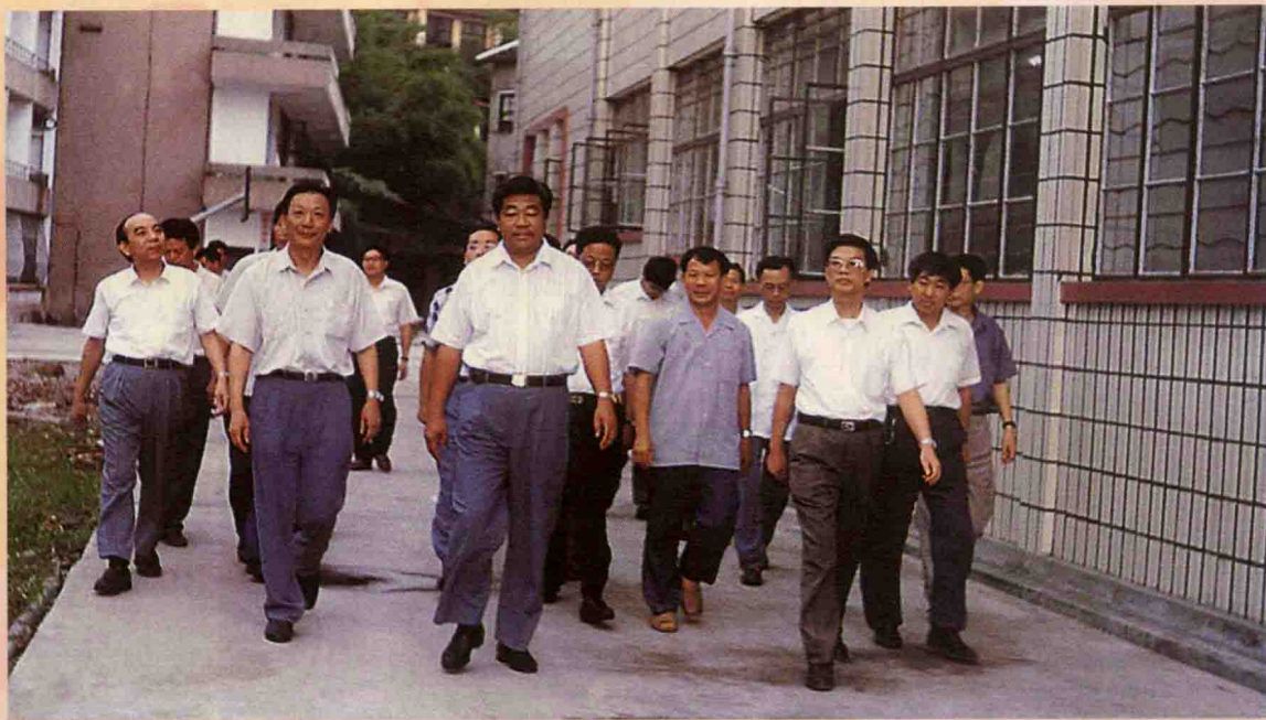
1994年8月，时任中共福建省委书记、现任中共中央政治局常委、全国政协主席贾庆林视察我校