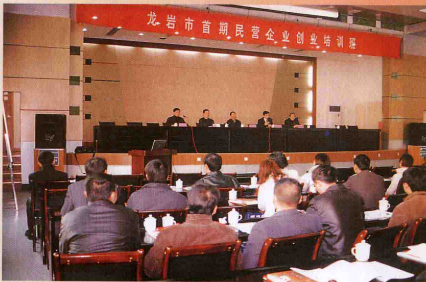
2005年，全面开展企业经营管理人员培训