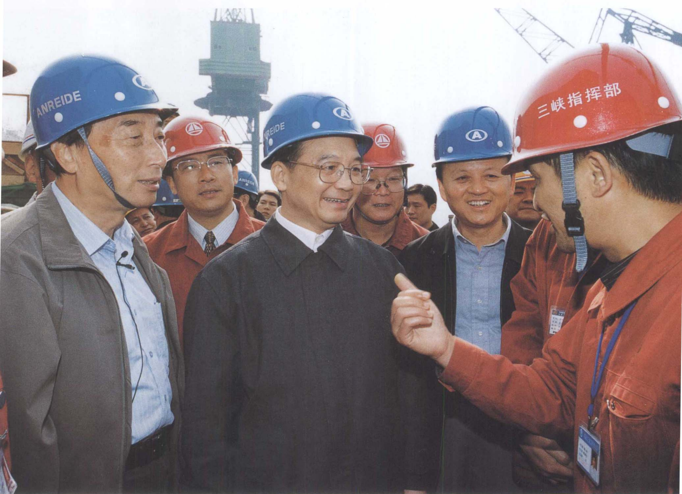
中共中央政治局常委、国务院总理温家宝视察三峡工地