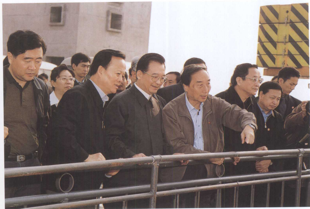
中共中央政治局常委、国务院总理温家宝(前排左三)视察三峡电站厂房