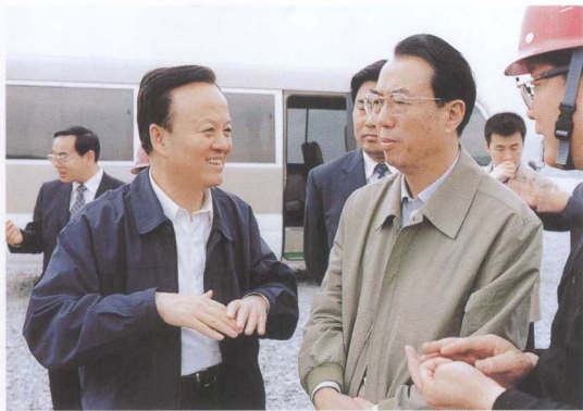
中国交通银行董事长殷介炎（右）考察三峡工程