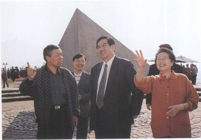
全国政协副主席李蒙（中）考察三峡工程