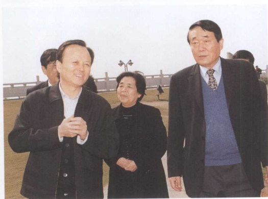
中国国际贸易促进委员会主任俞晓松（右一）参观三峡工程