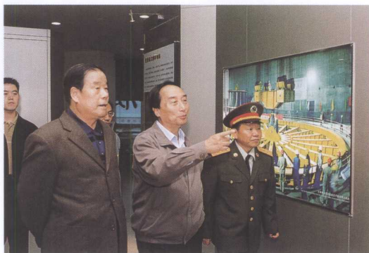
原中央军委委员傅全有上将（左一）、广州军区副政委张国初（右一） 考察三峡工程