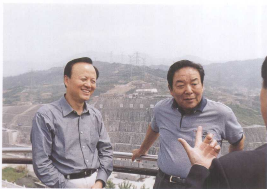
全国人大环境资源委员会副主任朱育理（右）考察三峡工程