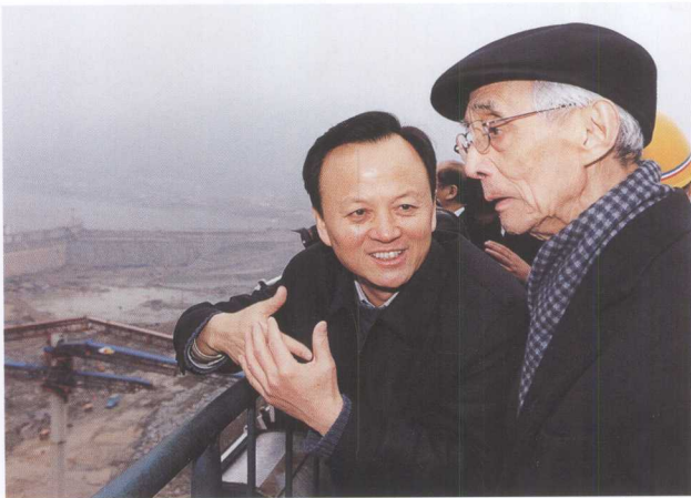
全国政协副主席、民生银行董事长经叔平（右）考察三峡工程