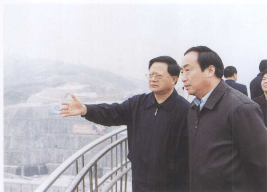
中共中央委员、全国供销社党组书记周声涛（左）考察三峡工程