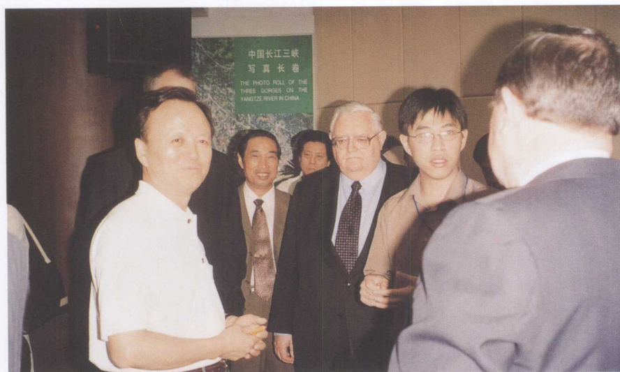
新西兰议会议长乔纳森·亨特（右三）参观三峡工程展览