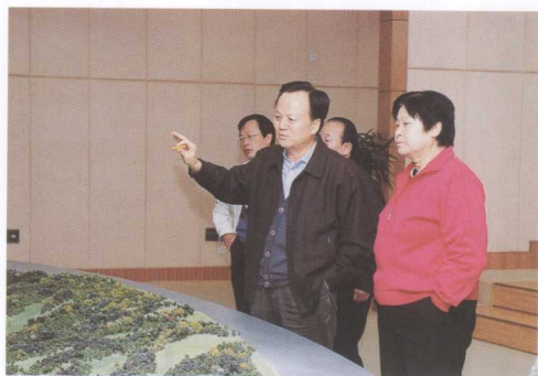
国家财政部副部长金莲淑（女）参观三峡展览