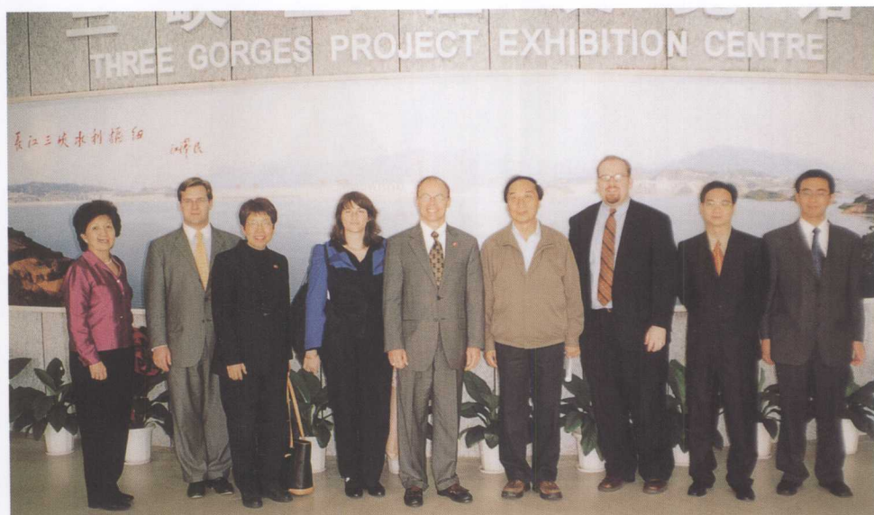
美国能源部副部长罗伯特·卡德（中）参观三峡工程