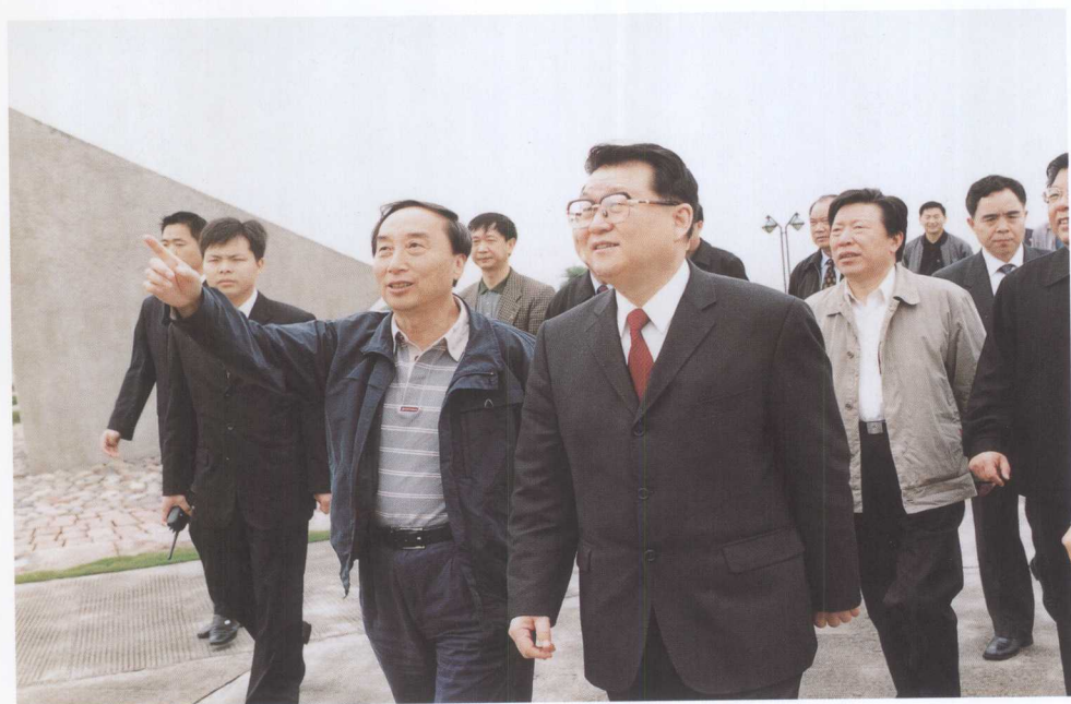
中共中央政治局常委李长春(前右)视察三峡工程