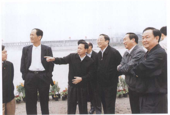
湖北省省委书记俞正声（右三）考察三峡工程