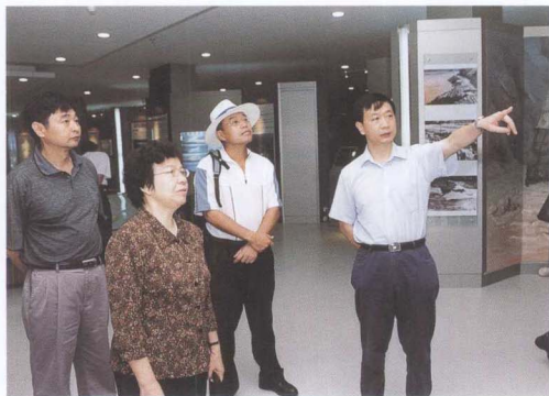
全国政协常委、广东省政协副主席韩大建（女）参观三峡工程