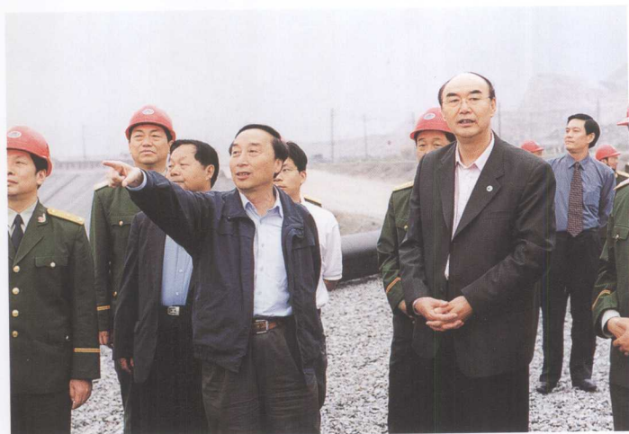
国家电网公司总经理赵希正（右一）考察三峡工程