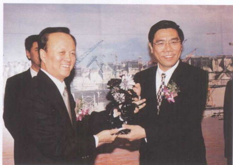
中国工商银行行长姜建清（右）参观三峡工程