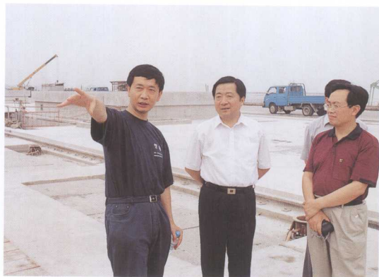
中央人民广播电台台长杨波（左二）参观三峡工程