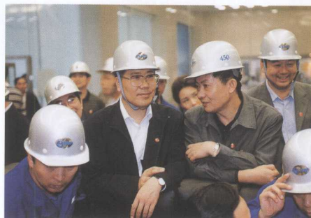
交通部部长张春贤（左二）考察三峡工程