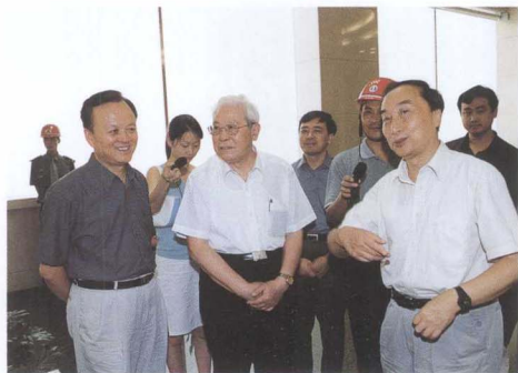
北京大学原校长吴树青（中）考察三峡工程