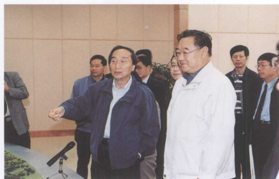
国有资产监督管理委员会副主任王瑞祥 （右）考察三峡工程