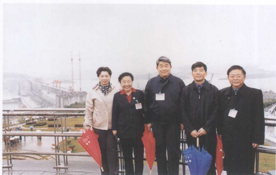
全国人大常委陶驷驹（中）、 全国人大常委、全国妇联副主席 赵地（左二）考察三峡工程