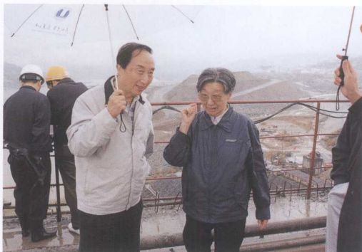
三峡工程质量检查专家组组长钱正英（右）在三峡工地