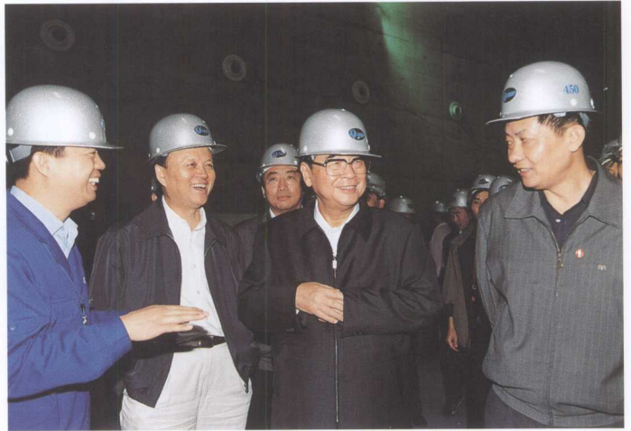
全国人大原委员长李鹏（右二）考察三峡工程