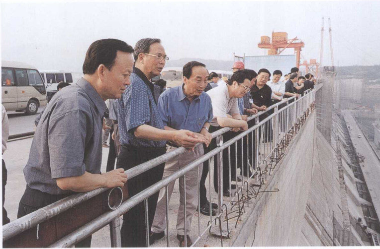
中共中央政治局委员、国务院副总理 曾培炎（左二）视察三峡工程