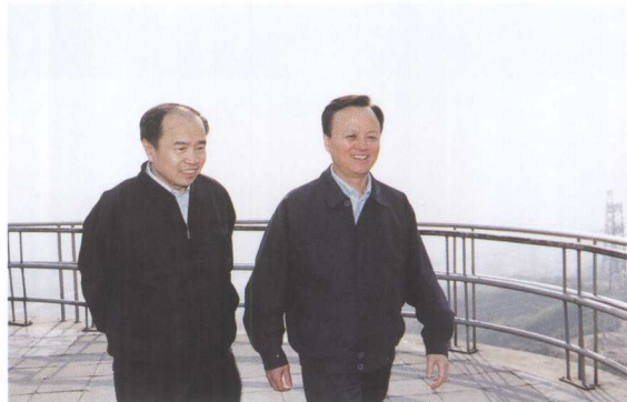
国家安全部常务副部长丁仁林（左）考察三峡工程