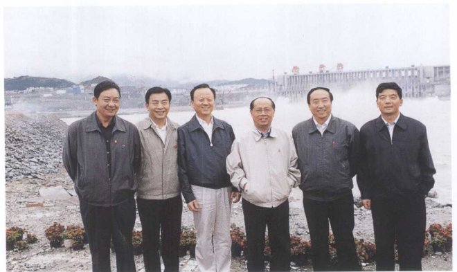
重庆市委书记黄镇东（右三）、市长王鸿举（左二）考察三峡工程