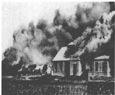
九一八事变当日的北大营

9月19日凌晨，一面日本旗升起在沈阳城大西门城墙，日军第二大队控制了内城的南北线。5时10分，第29联队的主力以铁甲车开路，占领东城墙的南北线。随即，日军进据东北边防军长官公署和辽宁省政府机关，沈阳全城沦陷。