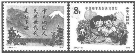
“中日友好”纪念邮票

邮票作为国家发行的邮资凭证，反映着各国的政治、经济、科学、文化、民族、人物、历史、地理、教育、体育等各方面的情况，也记录了一些重要历史事件和纪念日。