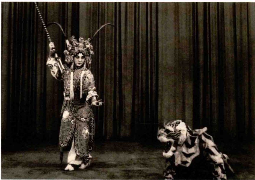
张君秋饰演柴郡主时的舞台照