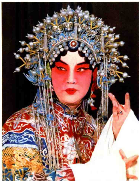
张君秋饰演柴郡主时的舞台照

奎与御林军赶到，便又勒转马头搭救柴郡主去了。赵光义误将傅丁奎认作救驾之人，便将柴郡主许配于他。柴郡主被杨延昭救下后，以珍珠衫相赠托付终身，并让他到南清宫去请八贤王赵德芳成全他们的姻缘。赵德芳召来新科状元吕蒙正让他为媒，两人一同去见赵光义，赵光义却错认搭救柴郡主的是傅丁奎不是杨延昭。八贤王不知所措，吕蒙正要他到柴郡主宫中问个明白。两人去见柴郡主，郡主说出了杨延昭搭救她的经过。这时皇上驾到，柴郡主请求在金殿之上辨明真假。金殿之上，吕蒙正令杨延昭、傅丁奎当面奏明救驾经过，孰是孰非真假立判。但傅丁奎倚仗皇上撑腰，强词夺理胡搅蛮缠。柴郡主当场戳穿了他的谎言，吕蒙正依照先王遗训：获得珍珠衫者为驸马，当即宣布认衫不认人。杨延昭亮出珍珠衫，傅丁奎方才无话可说。