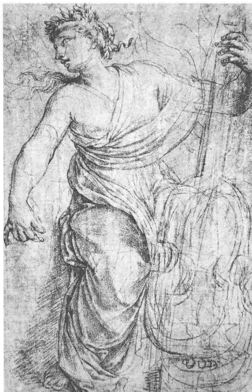
弹琴的女神 欧斯塔歌·勒修埃 (法)