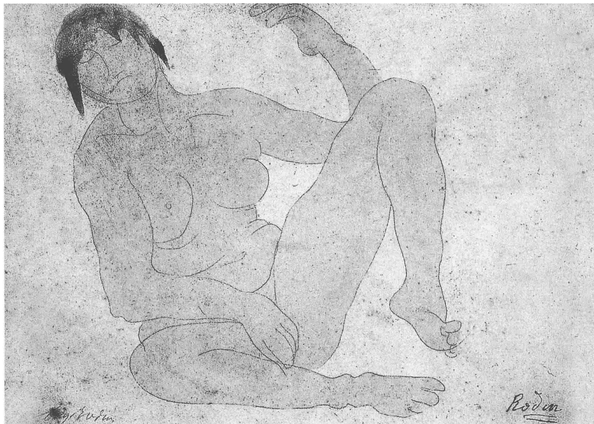
坐着的女人体 罗丹 (法)

马蒂斯以极简略的线条所勾画出的肖像，具有传神而富于语言韵味的特质，说明速写本身已具有艺术创作的丰富内涵。