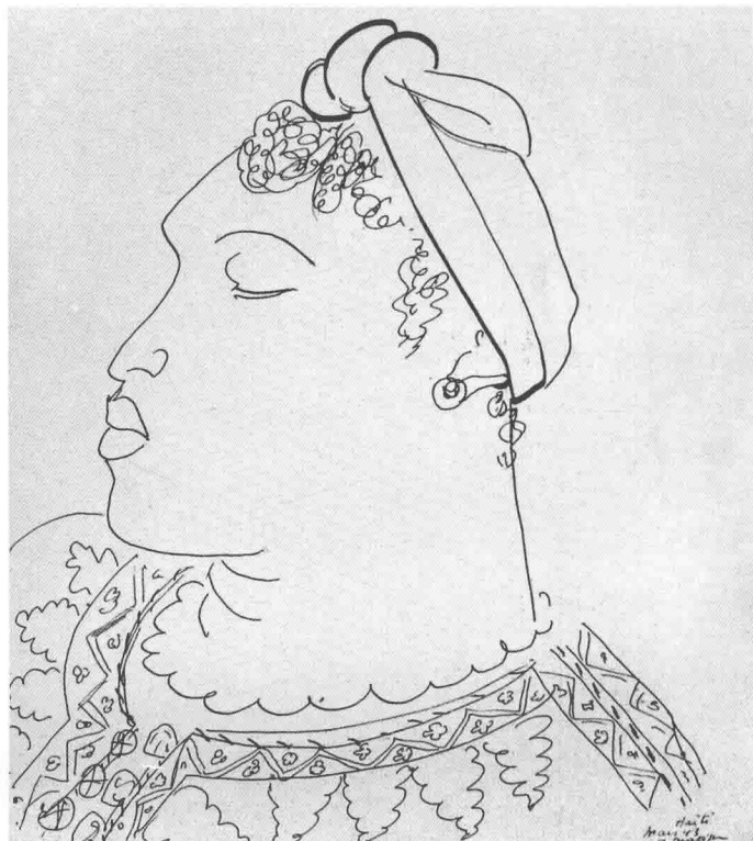
黑女人侧面像 马蒂斯 (法)

马蒂斯以极简略的线条所勾画出的肖像，具有传神而富于语言韵味的特质，说明速写本身已具有艺术创作的丰富内涵。