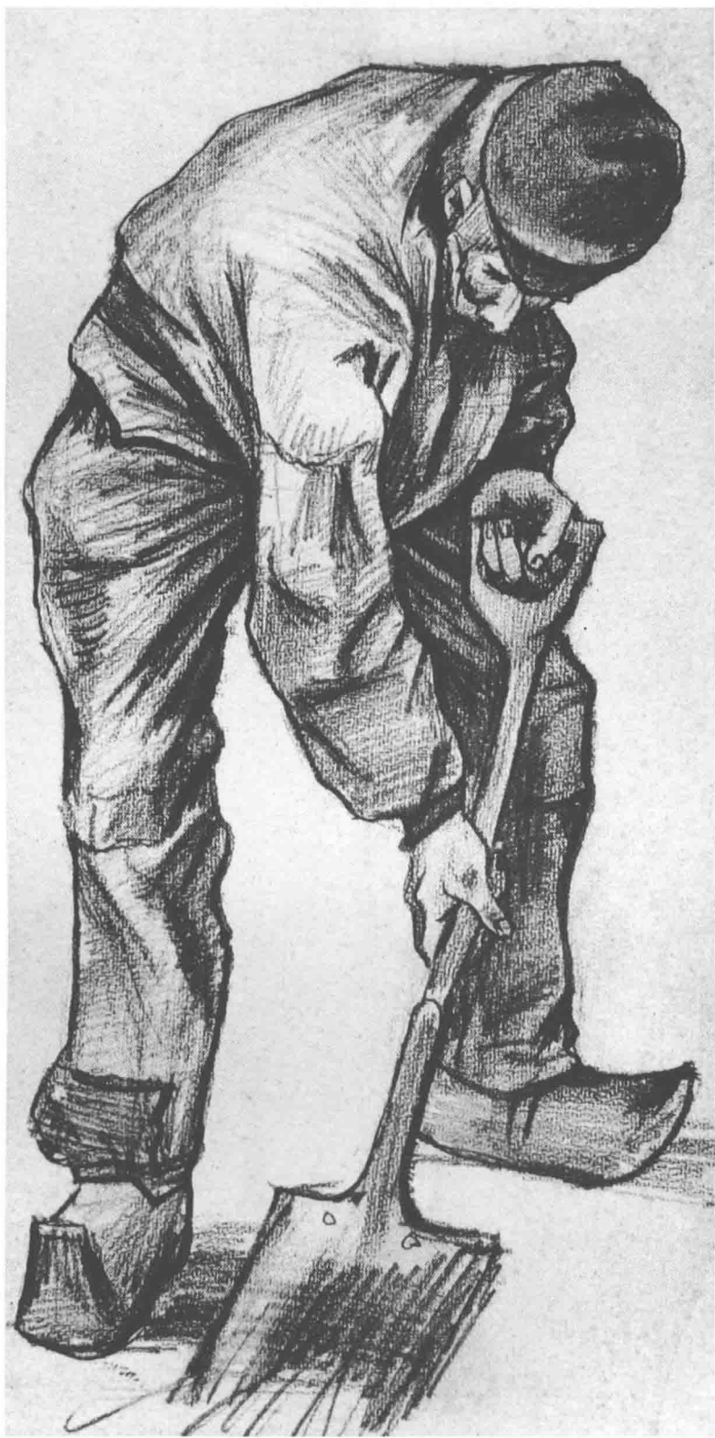
锄地的农夫 凡·高(荷)

速写具有简练、直接、随意、自由的绘画特色，是一种能够迅速捕捉和表现对象特征的绘画形式，是艺术家传达艺术情感、体现艺术追求、积累创作素材、记录和推敲艺术构思最直接有效的方法；速写还是造型艺术家的随身记录，它不受绘画材料、方法和题材的限制，简洁明快且方便随意。