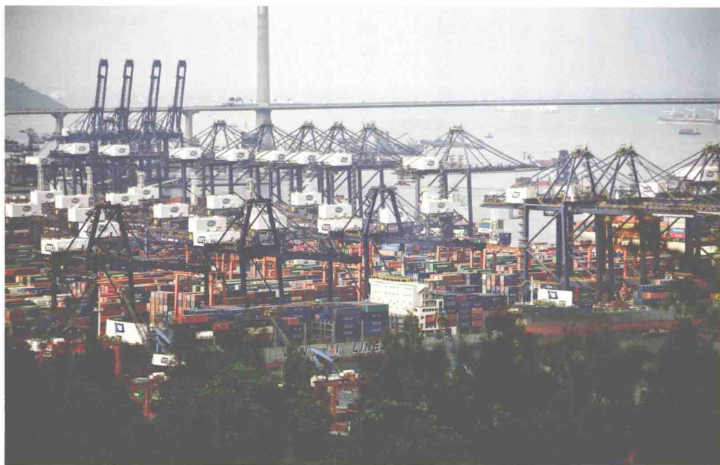
▲ 香港葵涌貨櫃碼頭——物流業的今生