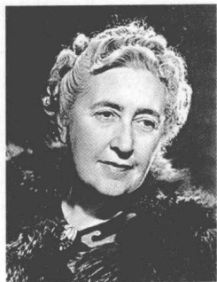
阿加莎·克里斯蒂 Agatha Christie (1890—1976)