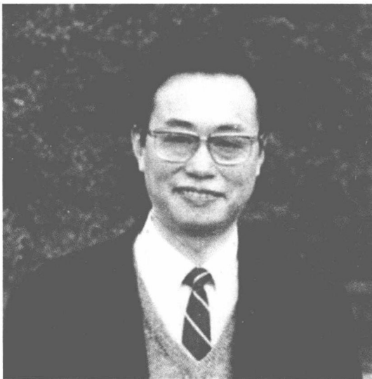
图一 1990年前后在密歇根大学讲学期间

童恩正先生（1935—1997年），湖南宁乡人，20世纪中国有重大国际影响的考古学家、文化人类学家、科幻作家；先后为峨眉电影制片厂编剧、四川大学教授、美国匹茨堡等多所大学教授；曾任中国铜鼓学会理事长、四川大学博物馆馆长、中国考古学会理事、四川省政协常务委员，中国科学文艺委员会主任委员（图一）。先生一生治学的特点是将田野考古学、文化人类学、民族学和历史学等相结合，将野外调查、发掘和室内研究相结合。他曾用“寒窗灯影，野岭霜晨”来形容自己的工作。寒窗灯影，则挑灯夜战，笔耕不息；野岭霜晨，则田野调查、发掘，起早摸黑，栉风沐雨。1998年重庆出版社出版了《童恩正文集》，共六卷，凡187万字，汇集了其一生主要作品。除文学作品外，在学术方面，其贡献主要在两个学科领域：一是建立起了西南民族考古学的学术体系；二是基本构建了中国文化人类学的学术框架。与同一代学者，即我国20世纪五六十年代中国大学自己培养出来的考古学家相比，先生不仅因成果多、学科广，获得了国内学术界及一般群众的广泛认同，还由于他成功地走向了国际学坛，获得了国际学界的高度认同。