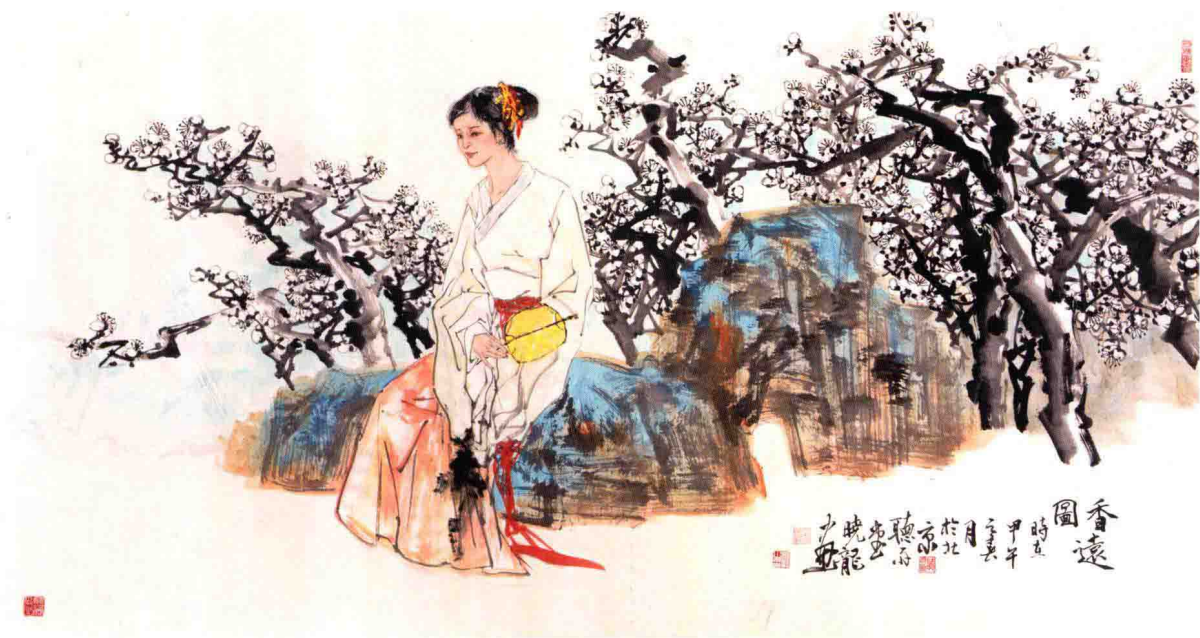
香远图 95cm × 180cm