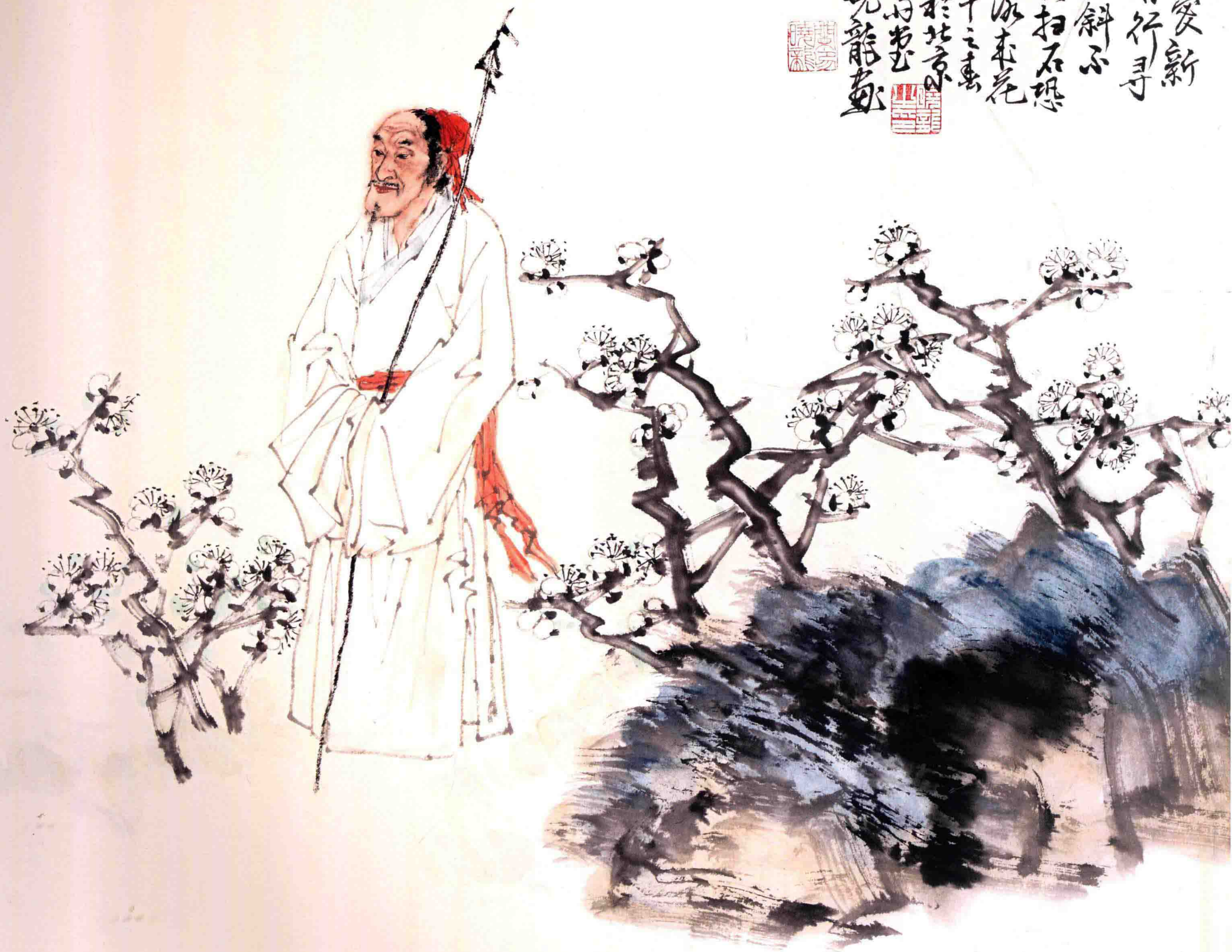
自愛新梅好行尋 65cm × 65cm