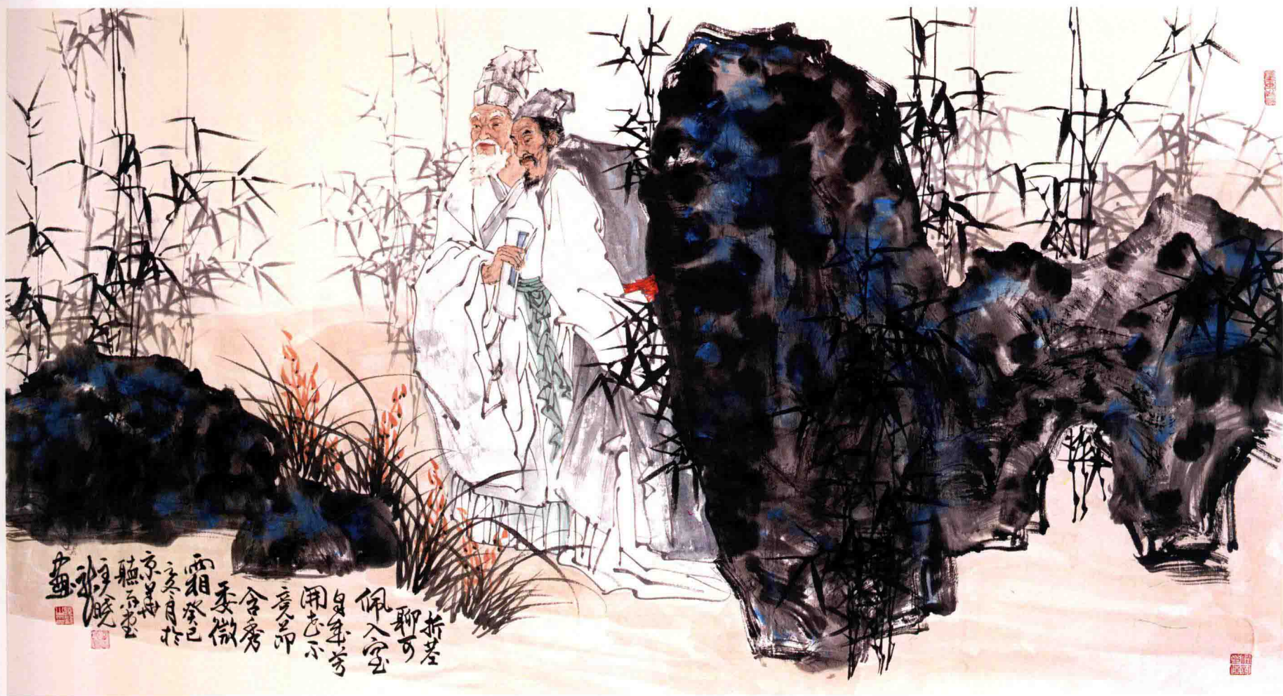
兰竹双清 95cm × 180cm