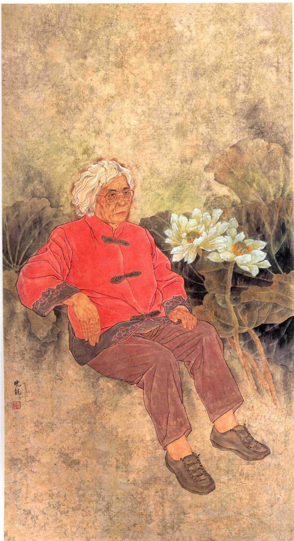
红烛颂 180cm x 95cm