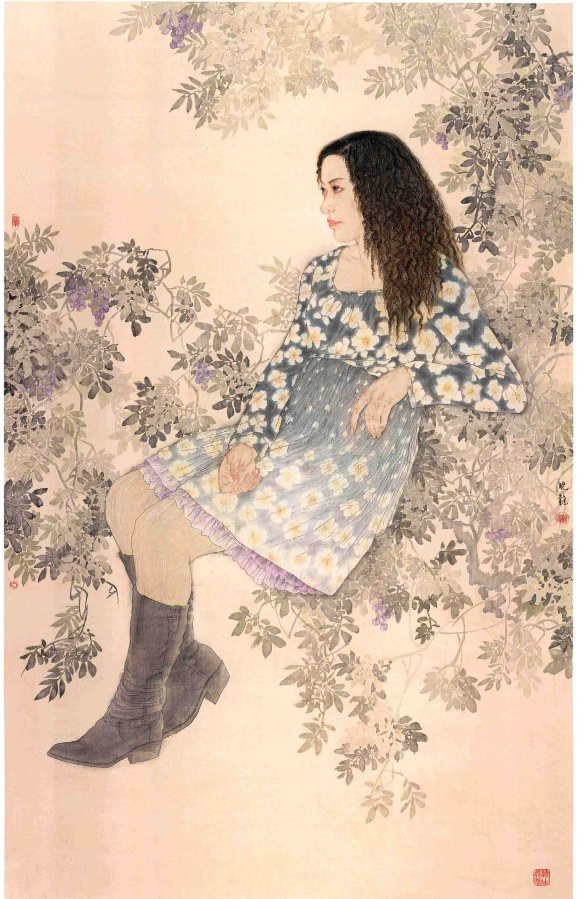
意韵 170cm x 120cm