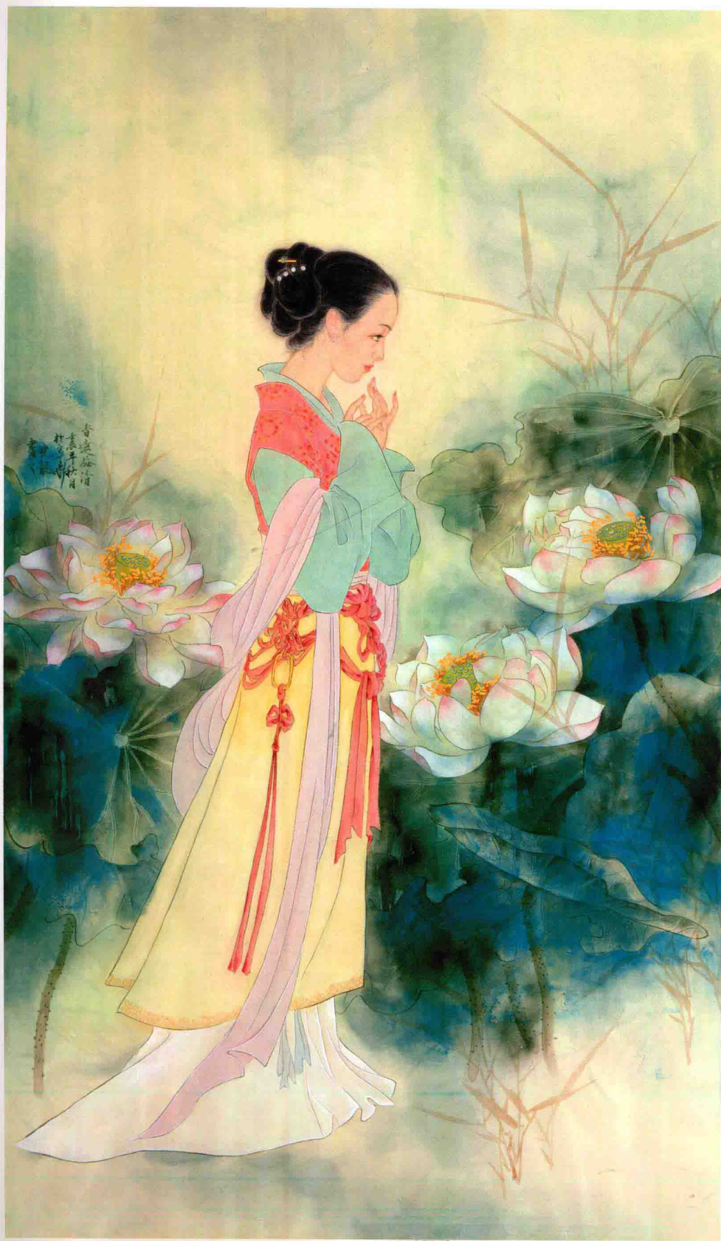
香远益清 130cm X 60cm