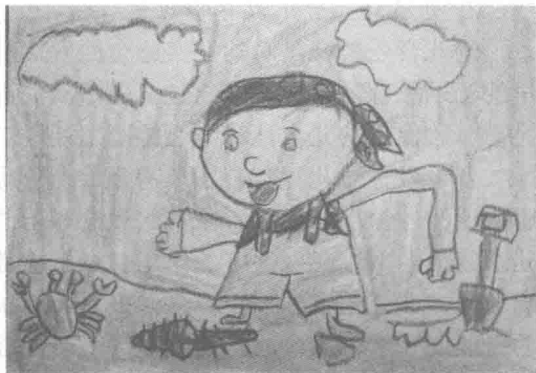
图 1-3 《海边》