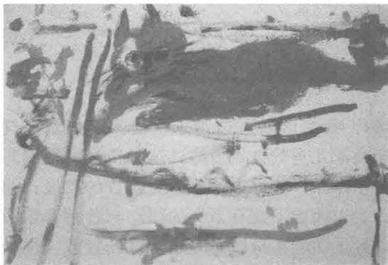
图 1-2 《猫咪》

生活中的很多题材在孩子眼中都是很有趣的。例如4岁幼儿画的《猫咪》(图1-2)，凭感觉画出了猫咪的基本形态。其构图别致，用笔轻松大胆，色彩主观性强，画面充满了童趣。又如5岁幼儿画的《海边》(图1-3)，小作者以独特的视角表现了小朋友在海边发现螃蟹、海螺时既高兴又惊奇的样子。其画面用笔大胆，线条灵活，造型简约概括，准确捕捉了人物的表情特征，画面生动自然，魅力十足。