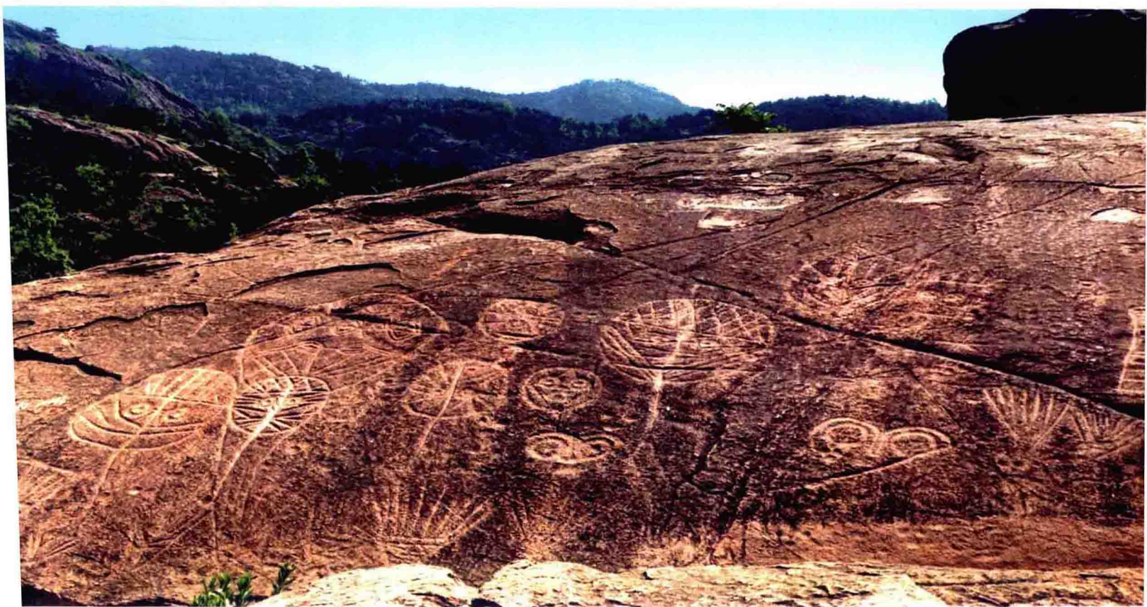
上_内蒙古阴山岩画中的原始符号, 生动地记录了人类的狩猎场景 下_江苏连云港将军崖岩画, 新石器时代晚期