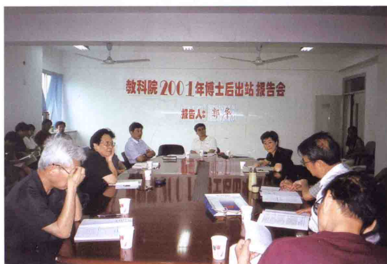
2001年, 参加教科院博 士后出站报告会。