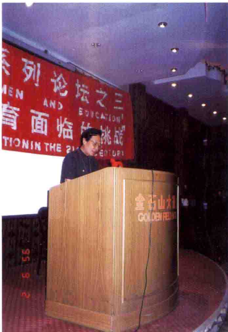
1995年，在联合国第四次世界妇女大会非政府论坛上发言。