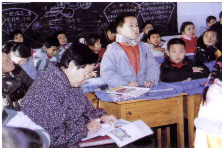
在南京江宁上元小学 听课