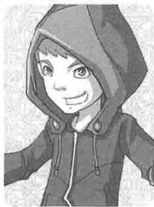
丹·卡希尔 ( Dan Cahill )

十四岁，有一头棕红色长发和翠绿色的眼珠。葛蕾丝的外孙女。内向腼腆，不善与人交流，隐藏自己情绪的方法是沉浸在书堆里，最爱待在图书馆，酷爱阅读。