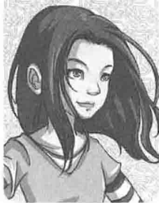
艾米·卡希尔 ( Amy Cahill )

十四岁，有一头棕红色长发和翠绿色的眼珠。葛蕾丝的外孙女。内向腼腆，不善与人交流，隐藏自己情绪的方法是沉浸在书堆里，最爱待在图书馆，酷爱阅读。