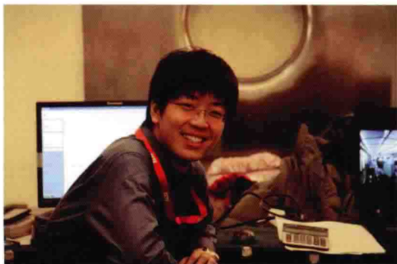
中央电视台工作照