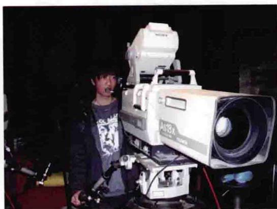
云南广播电视台实习