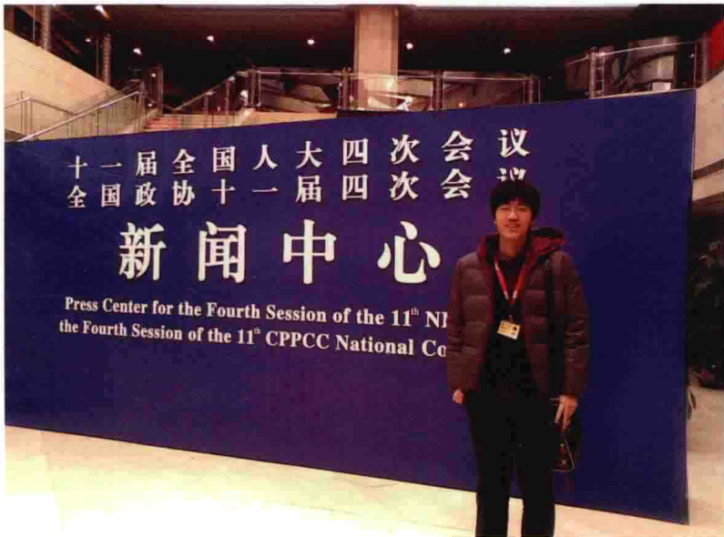
十一届全国两会期间工作照