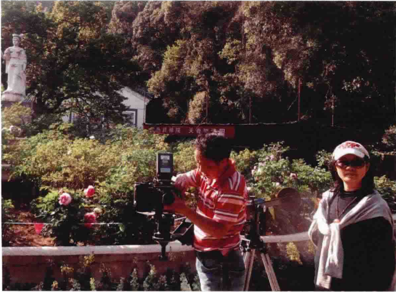
少数民族系列节目外景拍摄（一）