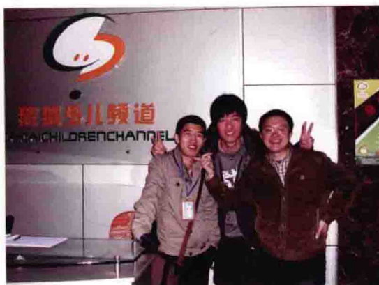
与云南广播电视台少儿频道编导合影