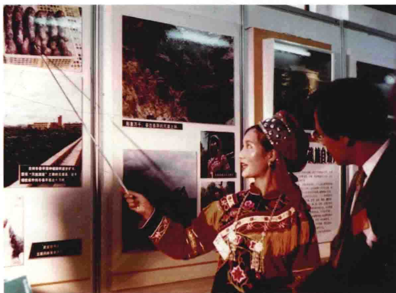
云南首届艺术节楚雄州展台解说