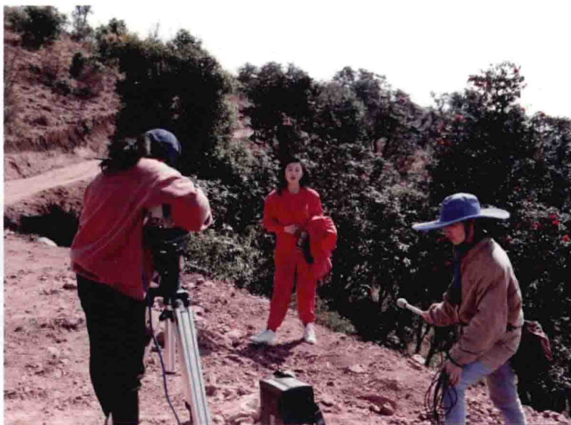
玉溪电视台节目拍摄现场