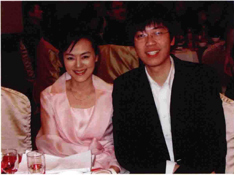
与中央电视台著名主持人孙晓梅合影