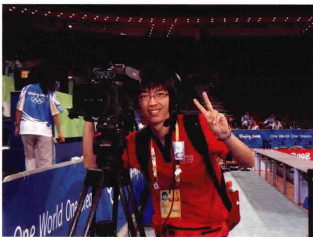
北京奥运会志愿者