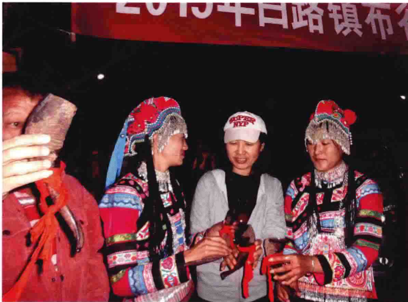
少数民族系列节目外景拍摄（二）