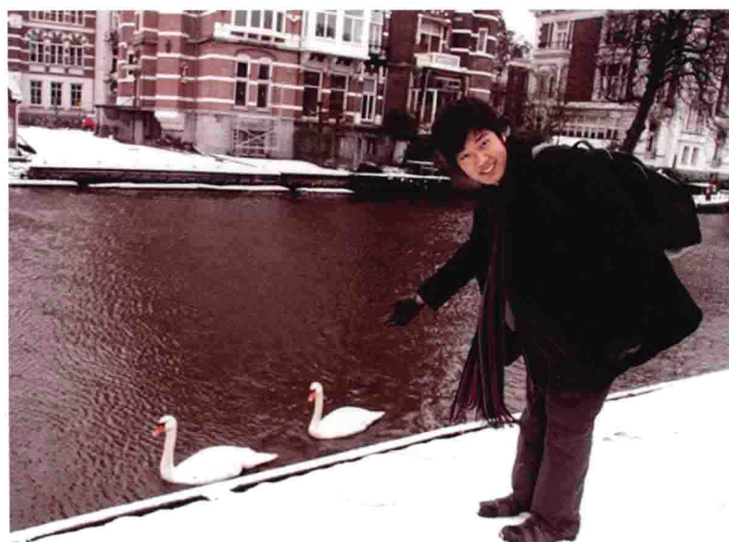
荷兰阿姆斯特丹游学留影