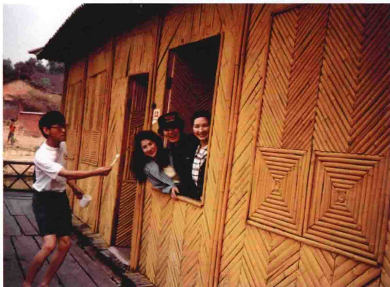
玉溪市电视台同事