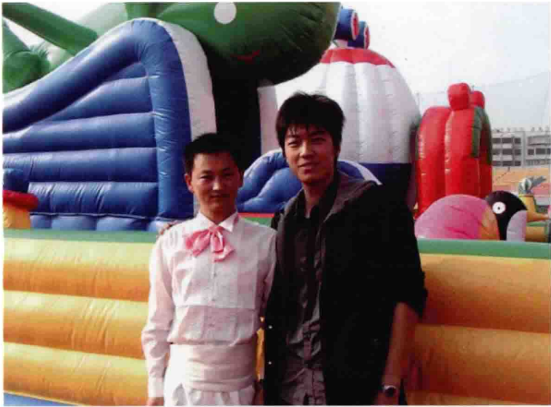
与云南广播电视台少儿频道主持人成立巍合影