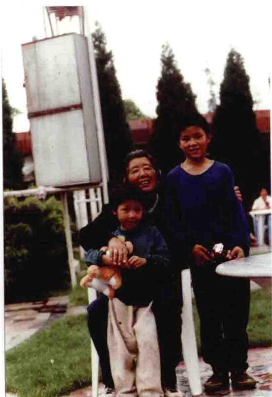
节目花絮（“小贵”专题活动）