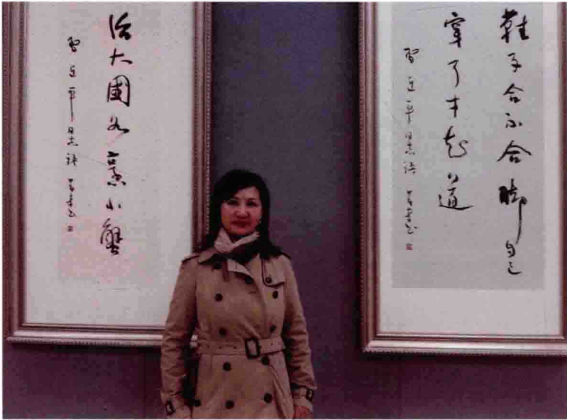
北京军事博物馆参观“梦圆中国书法展”