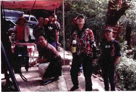
民族音乐纪录电影外景拍摄（一）