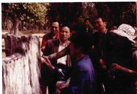
与中央电视台原副台长洪民生德宏考察合影