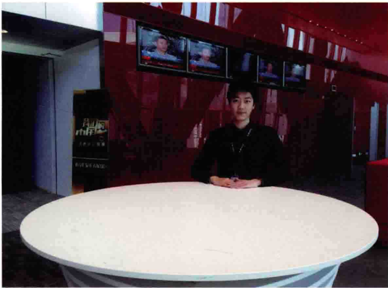
中央电视台新台址工作照