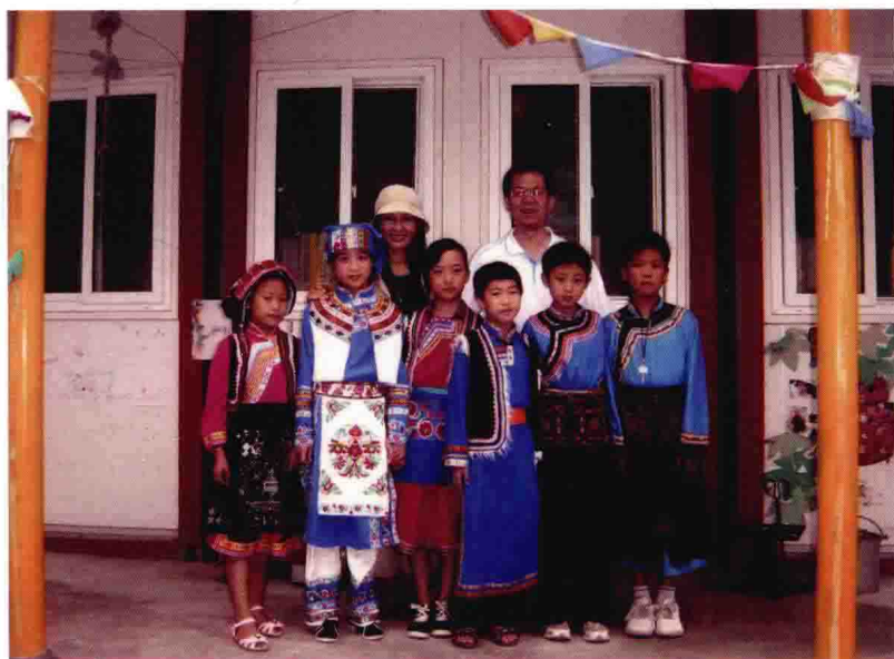
爱心进汶川（与羌族儿童合影）