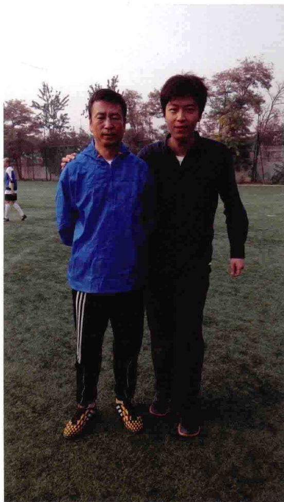
与中央电视台著名主持人白岩松合影