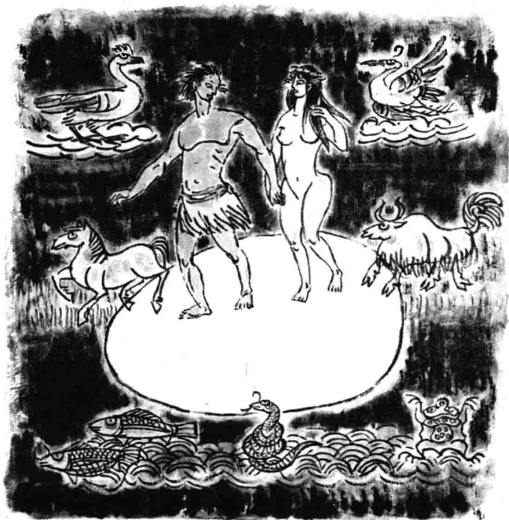
东巴教蛋生创世说