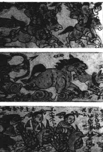
东巴阿才画的祭风图