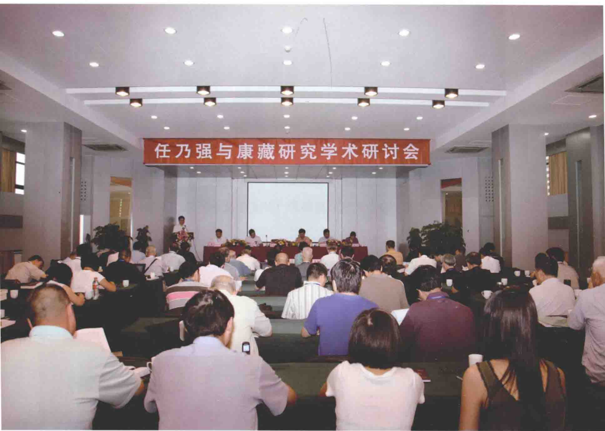
“任乃强与康藏研究学术研讨会”会场（2009年8月）