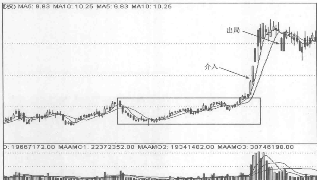
图 1-1 轴研科技 (002046) 2010 年 4 月走势

股市中的涨停板是短期内主力拉升做盘的极致，因此好的短线高手往往数日内赚了大家一年多赚到的钱。下面是我和学生们近期的实盘案例，收益还算不错，当然失败的案例也有，接近总数的 10%，以后这些案例也会拿出来和大家一起分析原因，在变化莫测的股市哪有万战不败的技法，我们能做的就是不断地提高操作的成功率。炒股是一门严谨的系统科学，求真务实是最起码的态度，不欺人，不自欺。