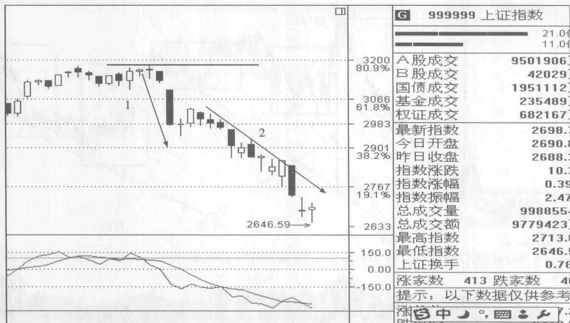
图 1-4 上证指数 2010 年 4~5 月走势