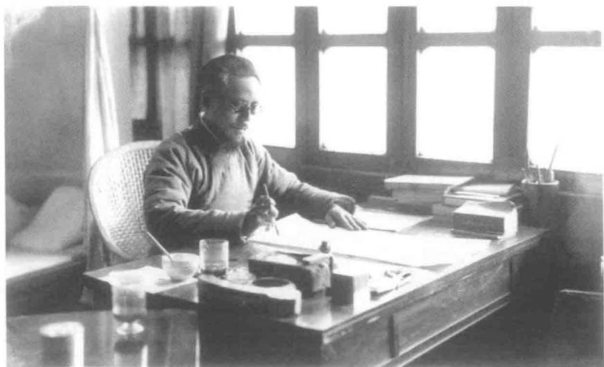
一九三七年春爸爸在缘缘堂二楼书房