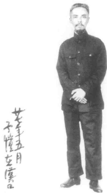
抗日战争时期爸爸在武汉着中山装留长须照