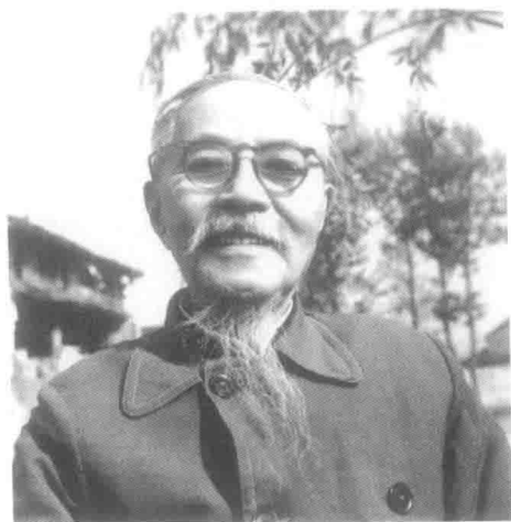
一九七五年爸爸最后一次回故乡