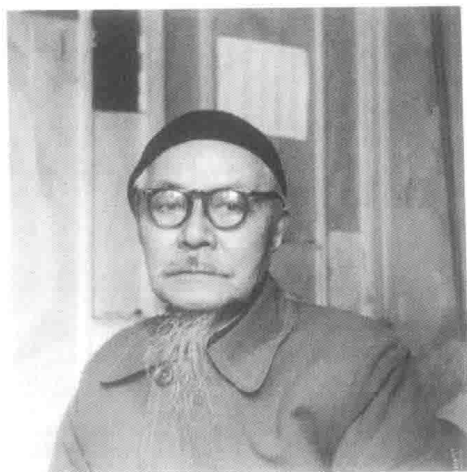
“切勿诉苦闷，寂寞便是福。” “文革”时爸爸寄给幼子新枚的诗句