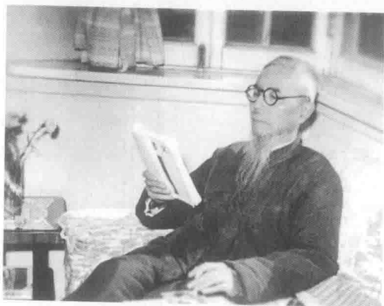
“饮酒看书四十秋，功名富贵不须求。 粗茶淡饭岁悠悠。”爸爸作于日月楼