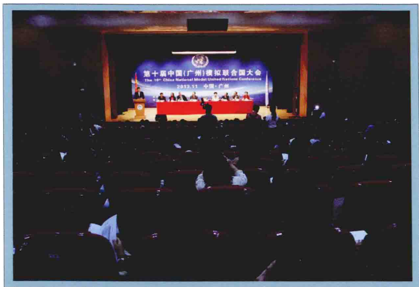
2013年第十届中国模拟联合国大会开幕式 (广东外语外贸大学)