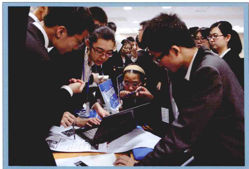
2013年第十届中国模拟联合国大会代表现场磋商