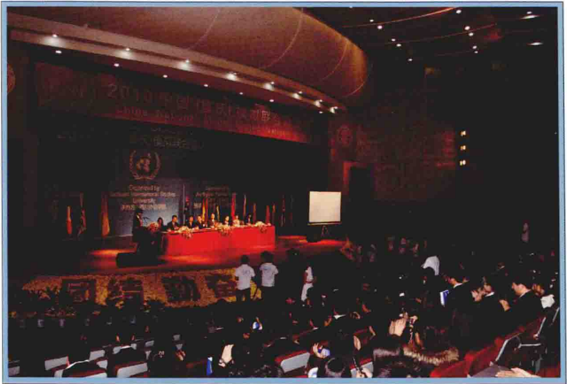
2010年第七届中国模拟联合国大会开幕式（四川外国语学院）