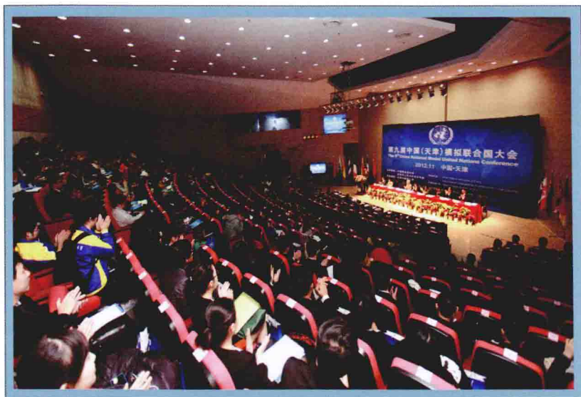
2012年第九届中国模拟联合国大会开幕式（天津外语大学）