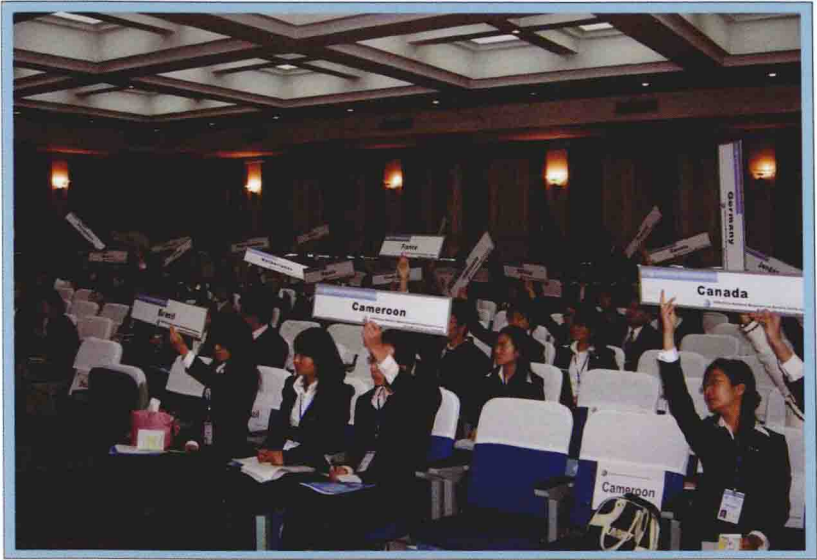
2006年第三届中国模拟联合国大会现场