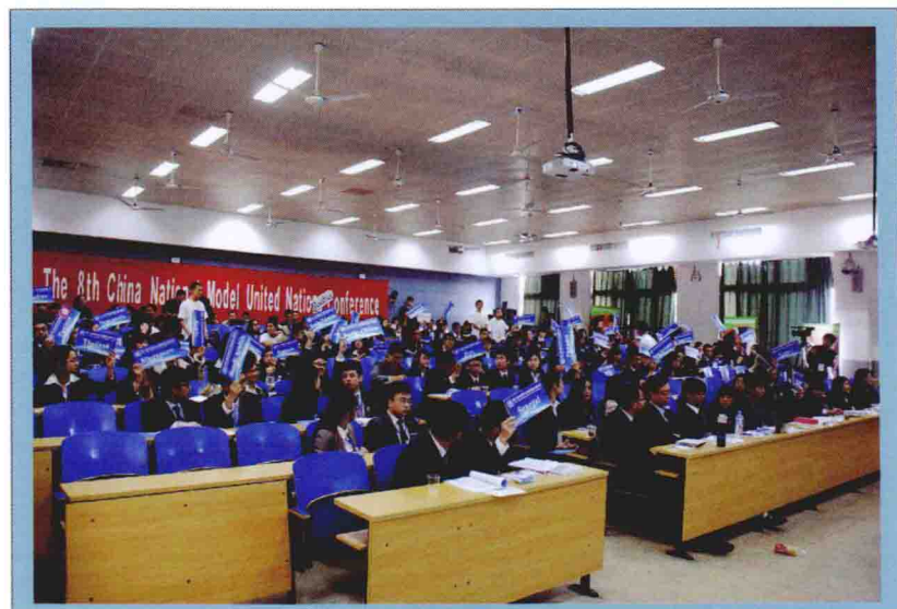
2011年第八届中国模拟联合国大会会场