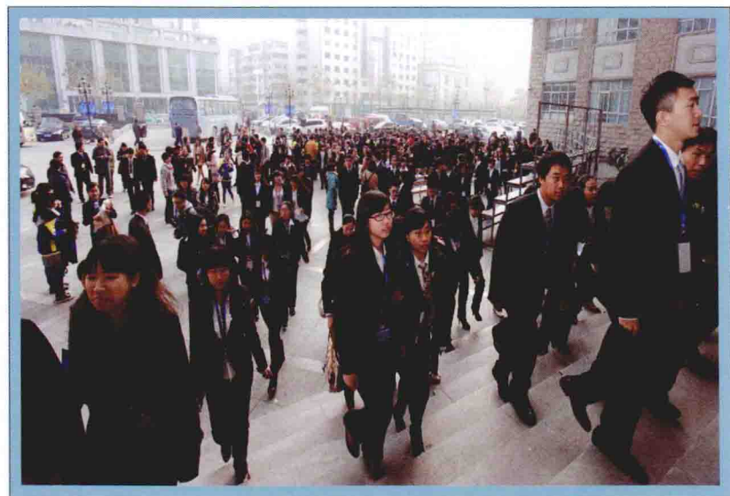
2012年第九届中国模拟联合国大会代表步入会场