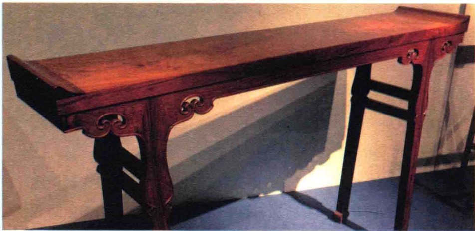
■ 催生仪式用的长凳