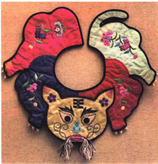
■ 儿童用的绣花围嘴