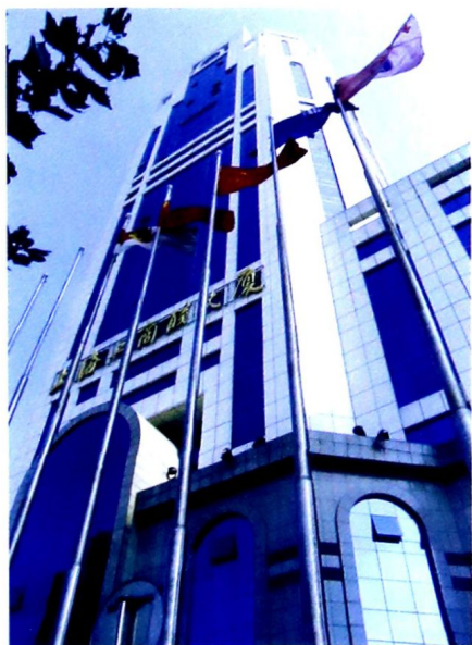
上海市工商联大厦。