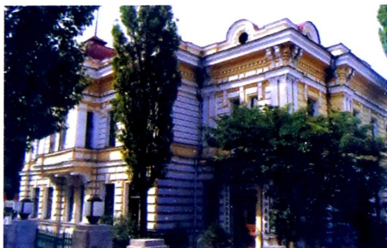
黑龙江省工商业联合会会址。