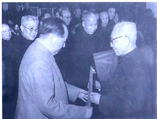
1956年天津市全面公私合营后,天津市工商联主任委员李烛尘向毛泽东主席报喜。