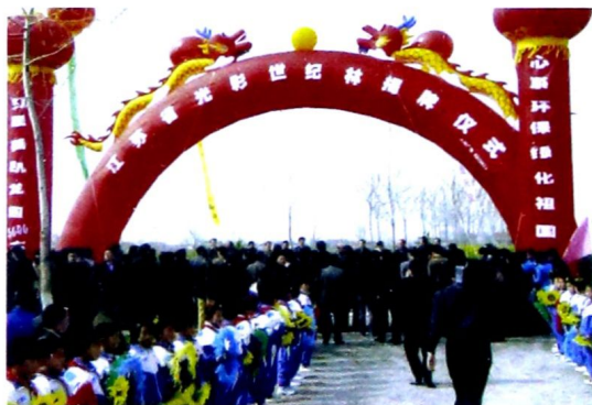
江苏省光彩世纪林揭牌仪式。