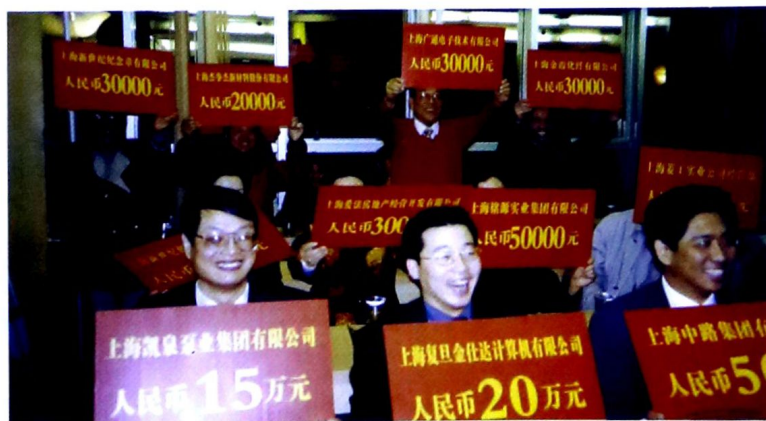
上海市民营企业积极投身社会公益事业。