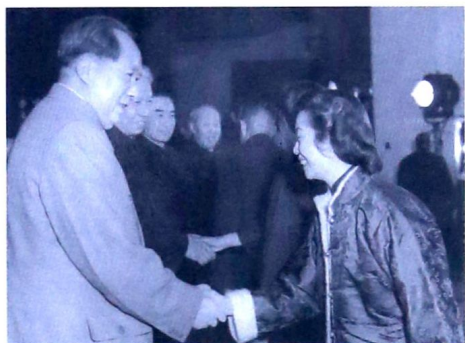
1956年毛泽东主席接见全国工商界妇女代表时与天津市工商界妇女代表戴翩英亲切握手。