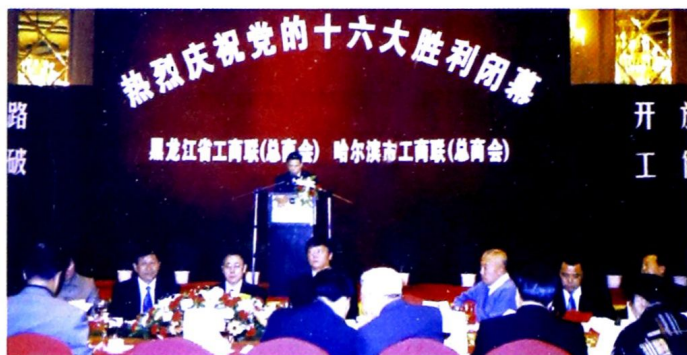
黑龙江省工商联和哈尔滨市工商联热烈庆祝党的十六大胜利闭幕。