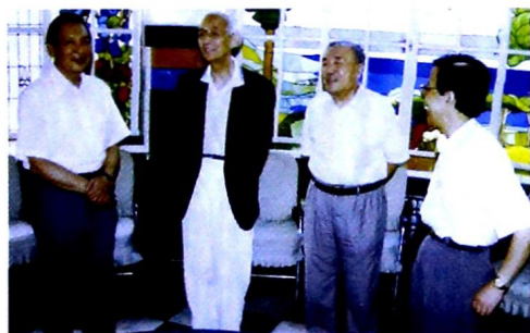
全国工商联主席经叔平到天津市工商联视察工作。