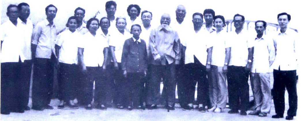
两会中央领导胡厥文(右八)、孙起孟(右九)来大连考察工作时合影。

2001年8月3日，全国政协副主席、全国工商联主席经叔平来大连考察，同工商联机关干部合影留念。