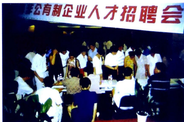
上海市非公企业为再就业工程作贡献。