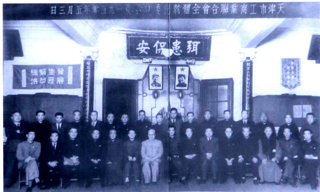
1950年5月3日,天津市工商业联合会成立时第一届全体执行委员合影。