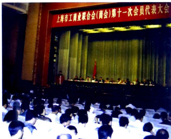
上海市工商业联合会(商会)第十一次会员代表大会。