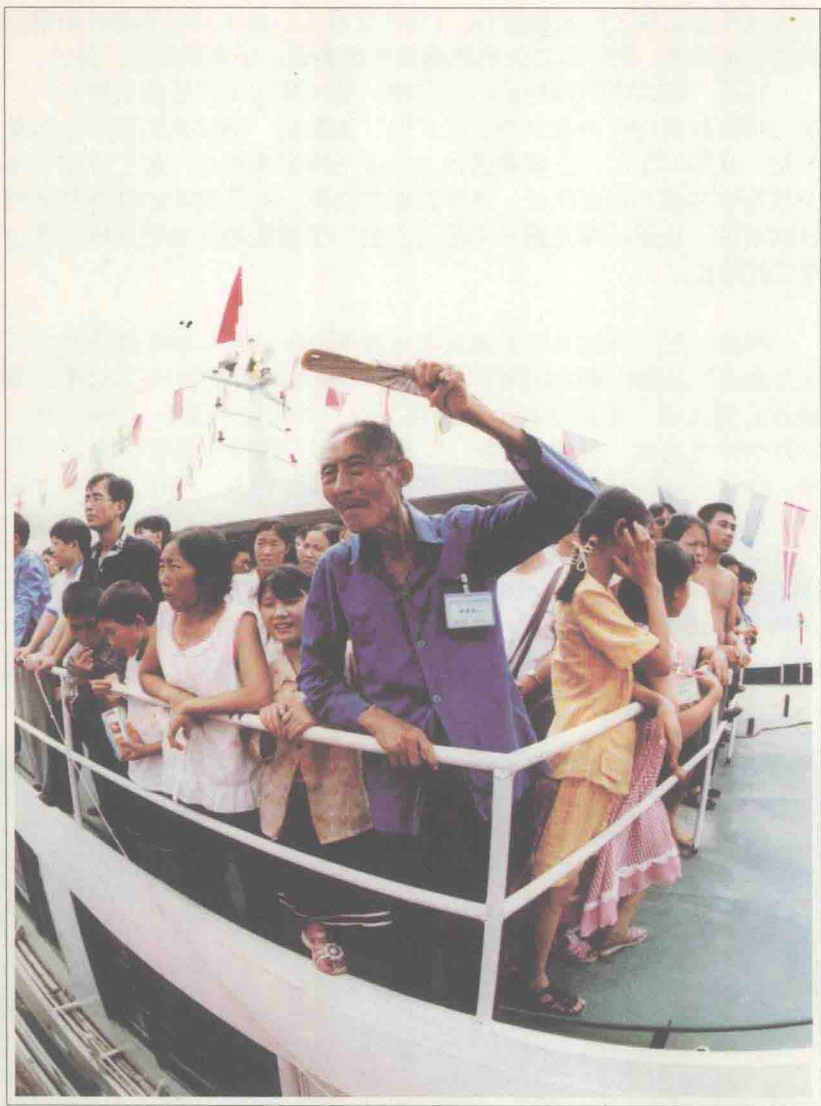
移民轮渡驶离码头,最后望一眼故乡的老人。

由不去关注她。据说三峡库区首批迁往上海崇明岛的移民,受到了全上海人的关注,三十多家媒体上百名记者云集上海码头。而在此次移民山东的过程中,亦有数十家媒体的数十名记者随行采访报道。