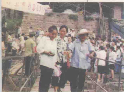
上船前，在离开故乡的最后时刻。