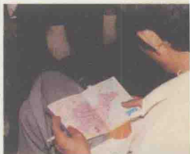
在火车上仔细查看山东地图，寻找自己的新家所在。