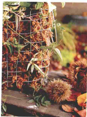
使用植物，以第一排菊花为中心，将素馨、常春藤、景天围绕种植，营造出秋季风情印象。

一年四季都可以放在室外阳光充足的地方种植。菊花会盛开1~2个月。待菊花凋零后，就可以更换冬季的鲜花了。菊花可以保留在花盆里也可以直接种在地面上。多花素馨、常春藤、景天都可以继续用在接下来的混栽中。