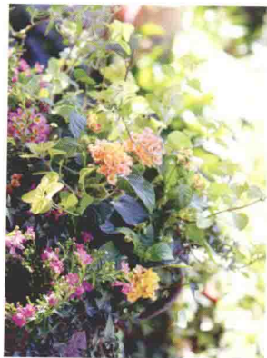
图1-2-3 马缨丹、萼距花、牛至、常春藤的混栽。通过一个圆形花架，让花茎向外延伸，营造出向外倾斜的圆形感觉。

牛至可以使用其他混栽中用过的植株进行再利用。移植时剪掉一点根须，并且进行间苗。马缨丹和萼距花在 11 月左右盛开。气候温暖的地区可以在户外越冬。常春藤与牛至稍微剪枝后可以继续使用在冬季的混栽中。