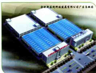
合肥新在线科技发展有限公司厂址鸟瞰图