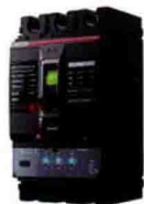
MB60系列塑壳式智能断路器