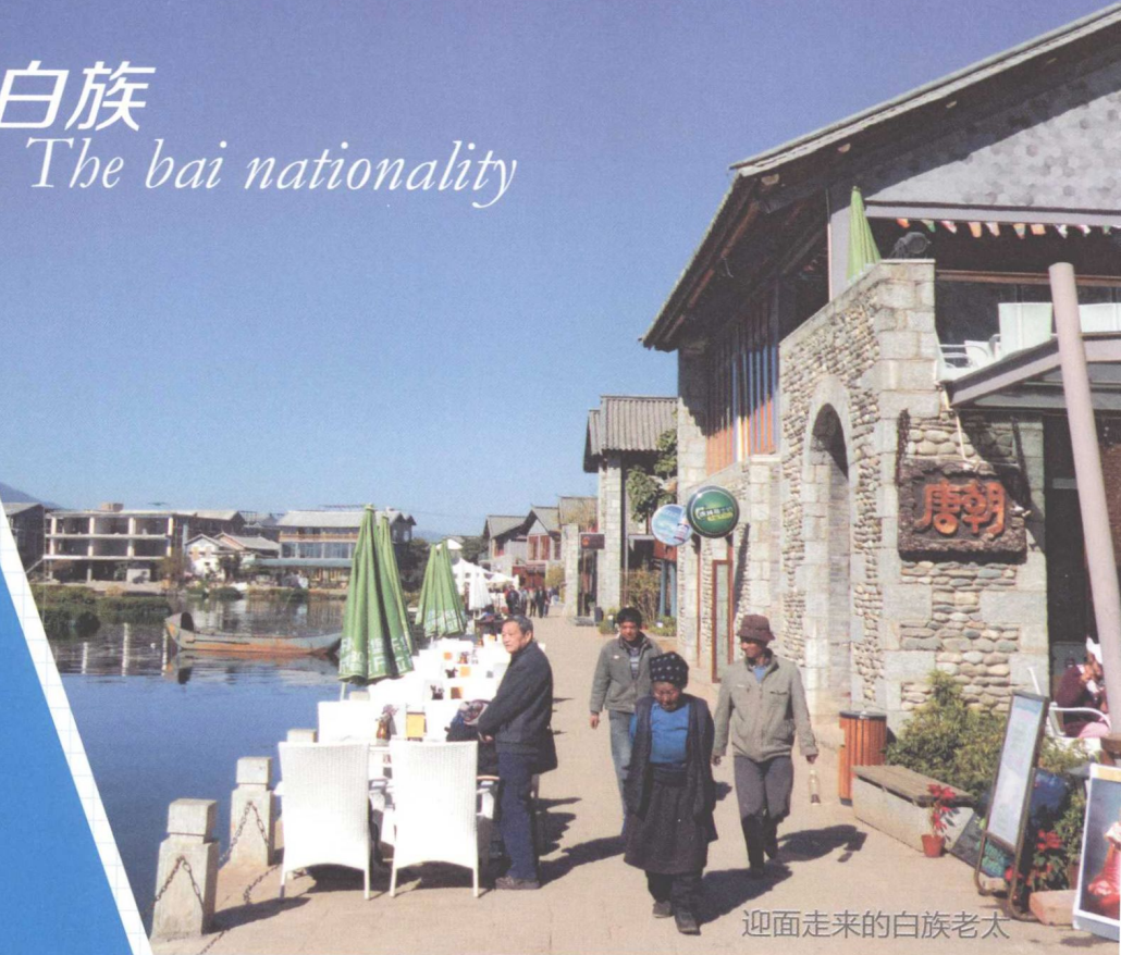
迎面走来的白族老太