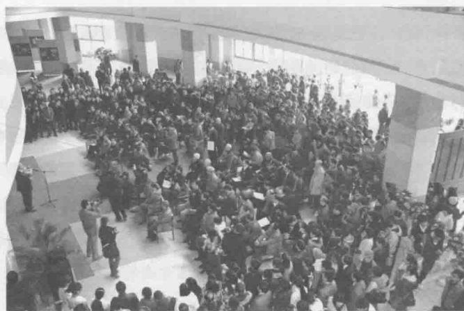
图1、图2 “可能的世界——邱振中书法作品展”开幕式现场