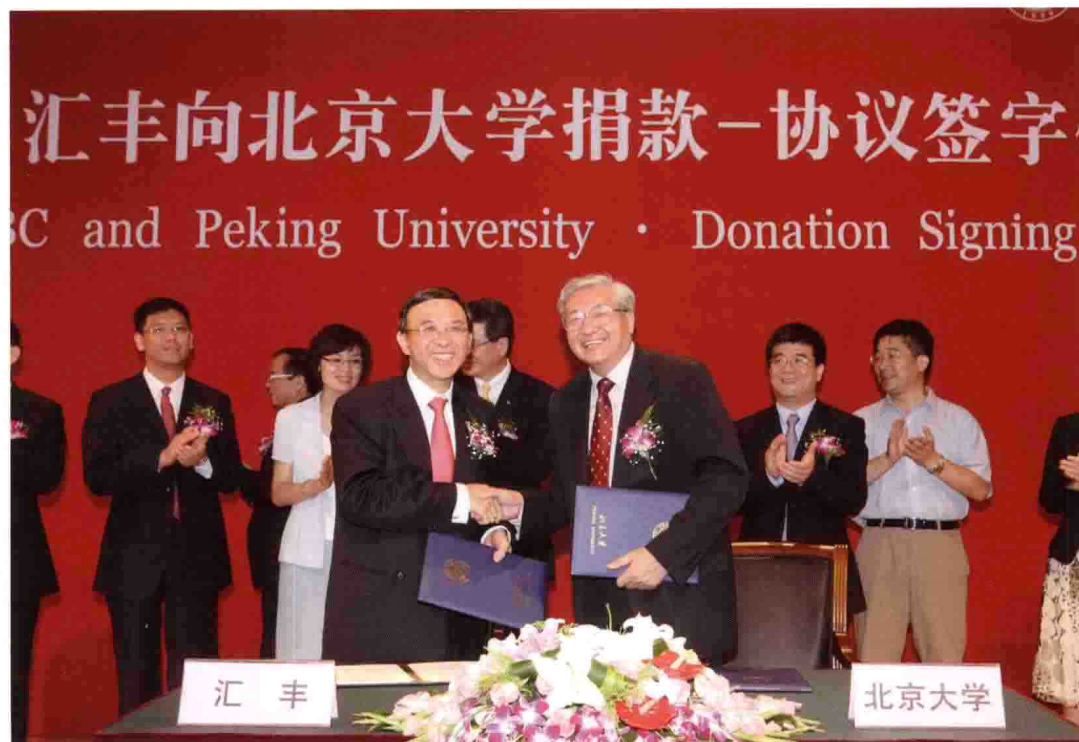
2008年8月30日，汇丰银行捐赠冠名签字仪式