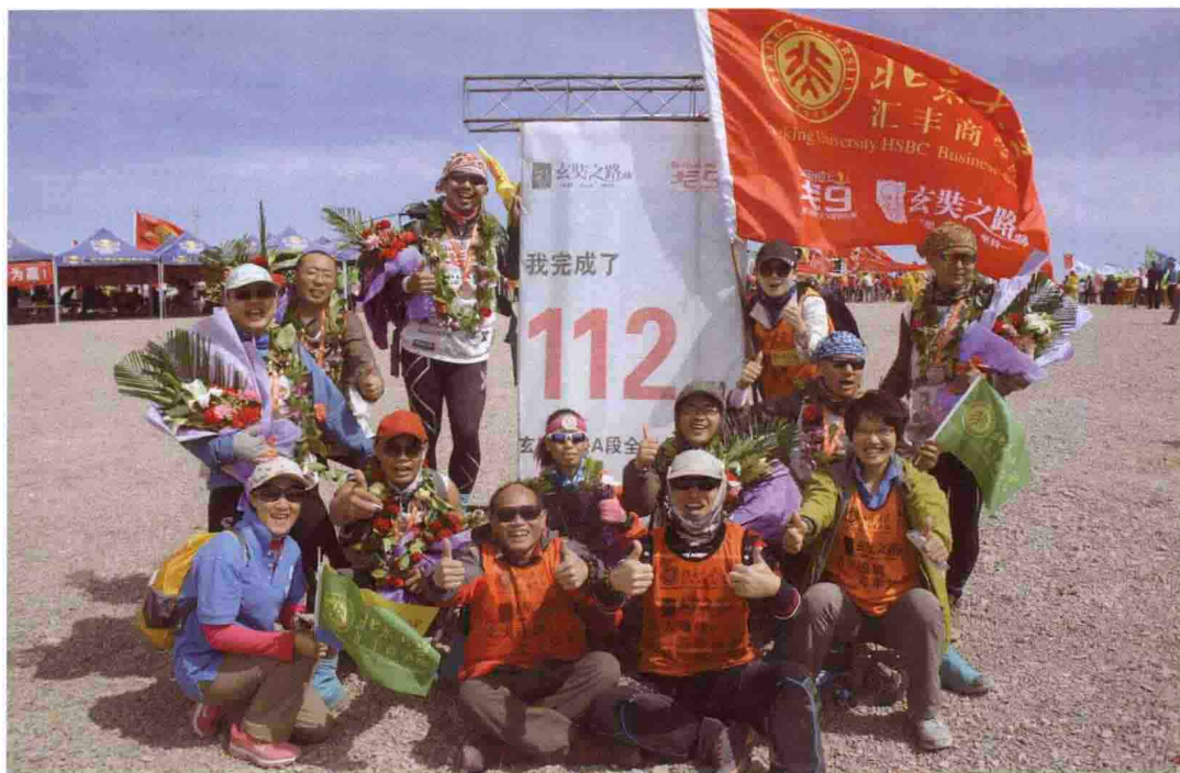
2014年，EMBA学生首次参加商学院戈壁挑战赛（戈壁9）