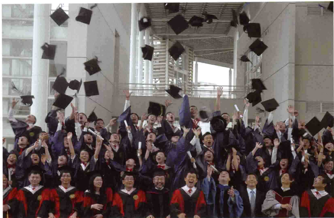
2008年7月，首届硕士生毕业