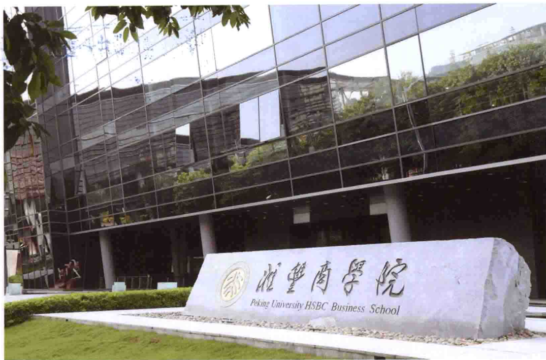
北大汇丰商学院大楼正门外景