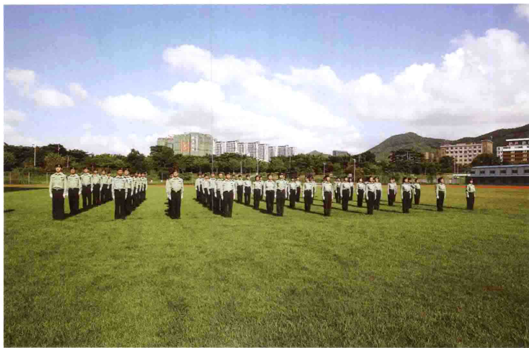
2013年8月，军训汇报表演