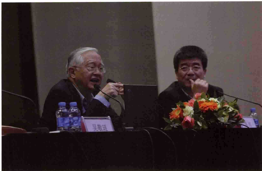
2008年12月，著名经济学家吴敬琏教授在北大汇丰商学院开办讲座