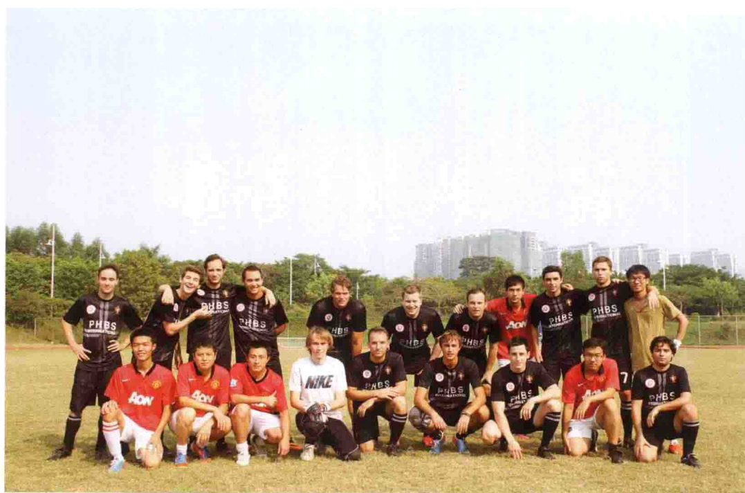
国际化的学生足球队