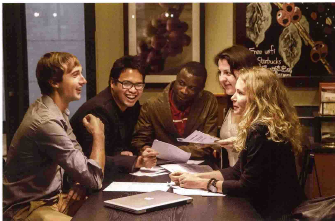
留学生在进行课后讨论