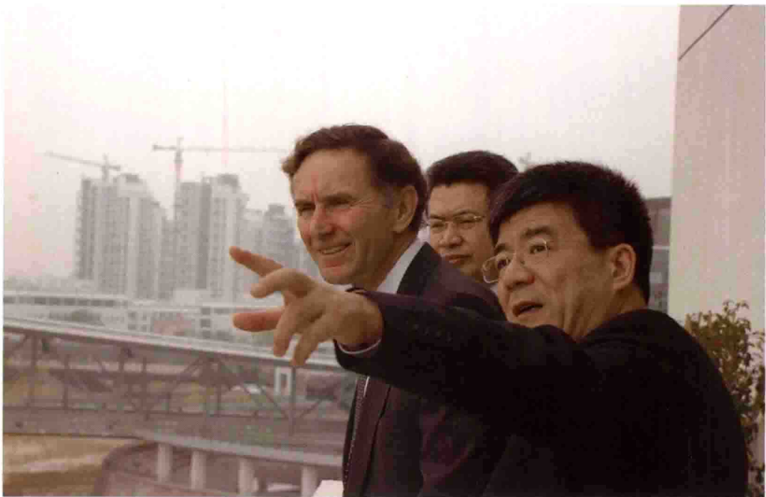
2008 年 3 月 18 日，汇丰集团董事长葛霖（S. Green）考察北大深圳商学院