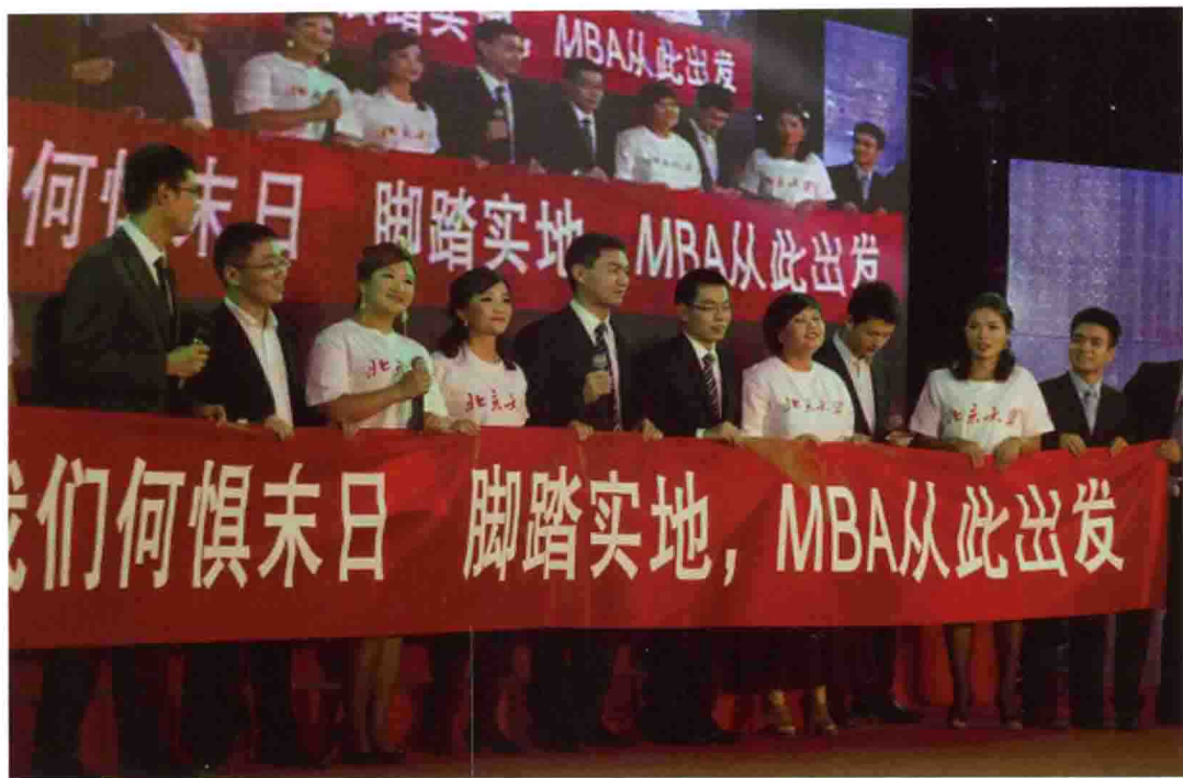
2012年12月，新年晚会上首届MBA表演节目