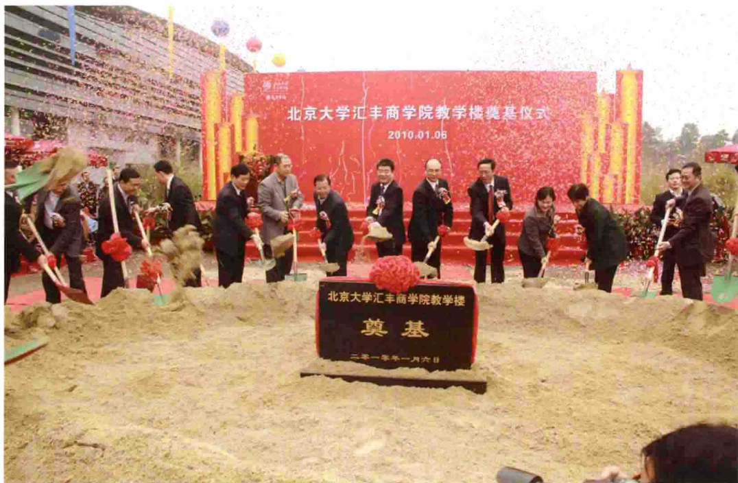
2010年1月6日，北大汇丰商学院新大楼奠基仪式