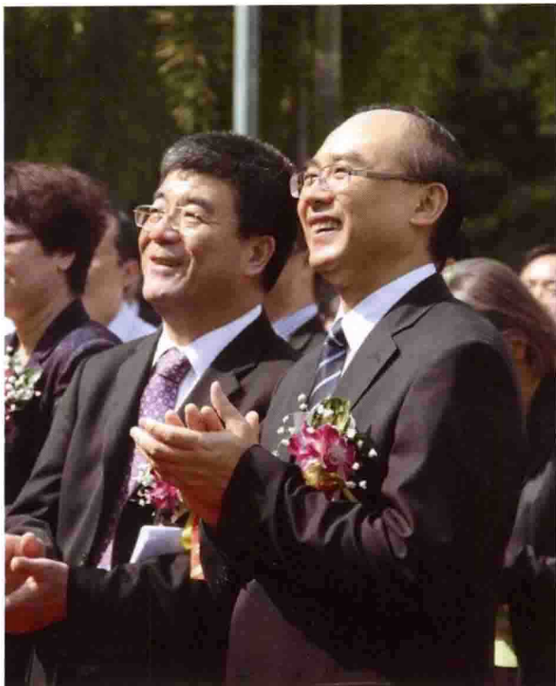
2010年1月6日，北大汇丰 商学院新大楼奠基仪式上海 闻与深圳市市长许勤