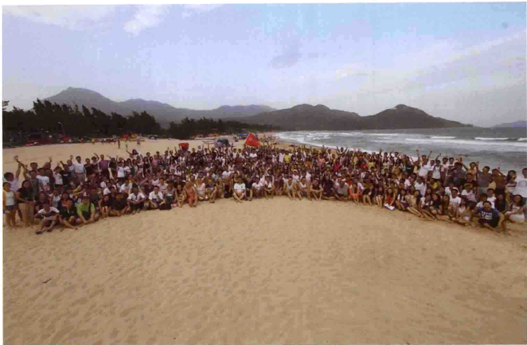
2013年9月，2013级新生在深圳西冲海边秋游