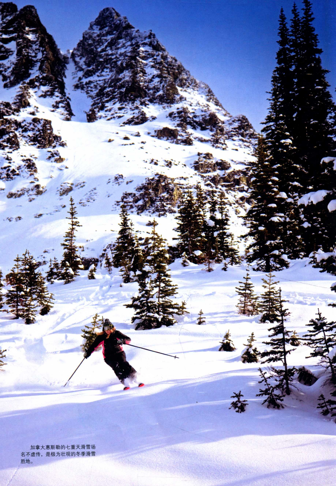
加拿大惠斯勒的七重天滑雪场名不虚传，是极为壮观的冬季滑雪胜地。