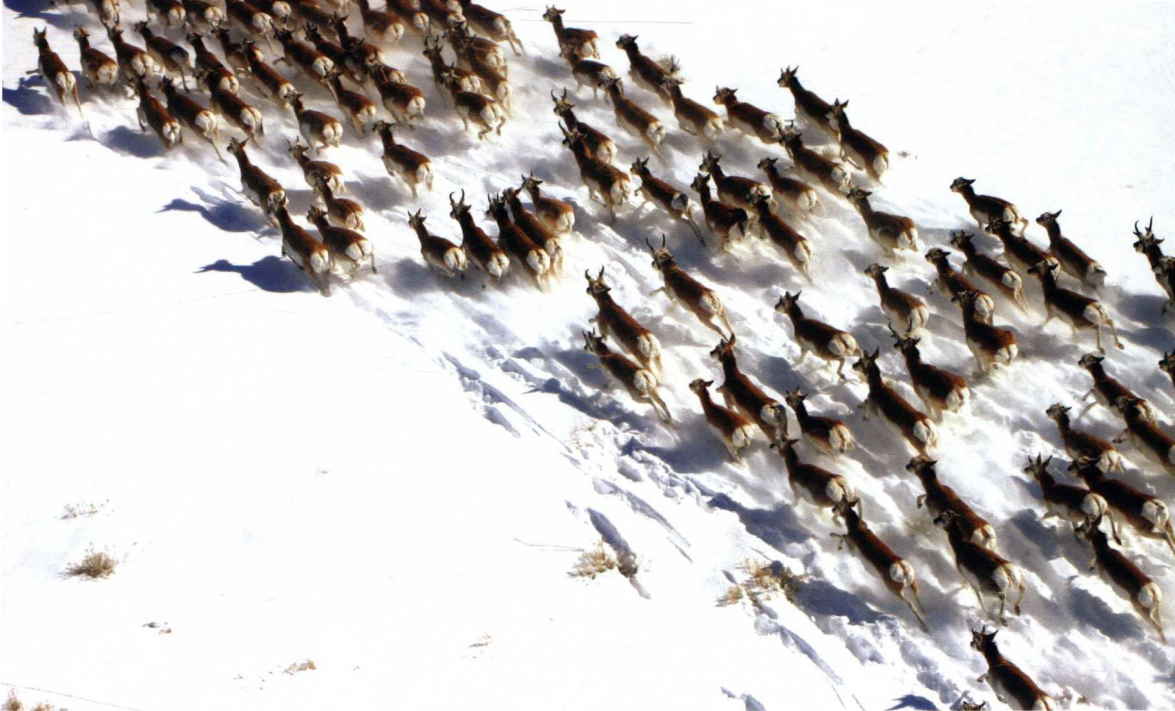
爱达荷南部春天来临的一个重要标志就是美洲羚羊在残留的积雪上奔跑而留下的痕迹。