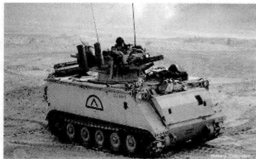
图 1.2 美国火神 M163 式 6 管 20 mm 自行高炮