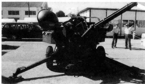
图 1.1 美国火神 M167 式 6 管 20 mm 牵引高炮

根据火炮自动化程度不同,可以将火炮分为自动火炮(简称自动炮)、半自动火炮(简称半自动炮)和非自动火炮(简称非自动炮)三类。自动炮是指能自动完成重新装填和发射下一发炮弹的全部动作的火炮。若在重新装填和发射下一发炮弹的全部动作中,部分动作自动完成,部分动作人工完成,则此类火炮称为半自动火炮。若全部动作都由人工完成,则此类火炮称为非自动火炮。自动炮能进行连续自动射击(连发射击,简称连发),而半自动炮和非自动炮则只能进行单发射击。美国6管20 mm自动炮就分别装备于陆、海、空三军,如图1.1~图1.4所示。