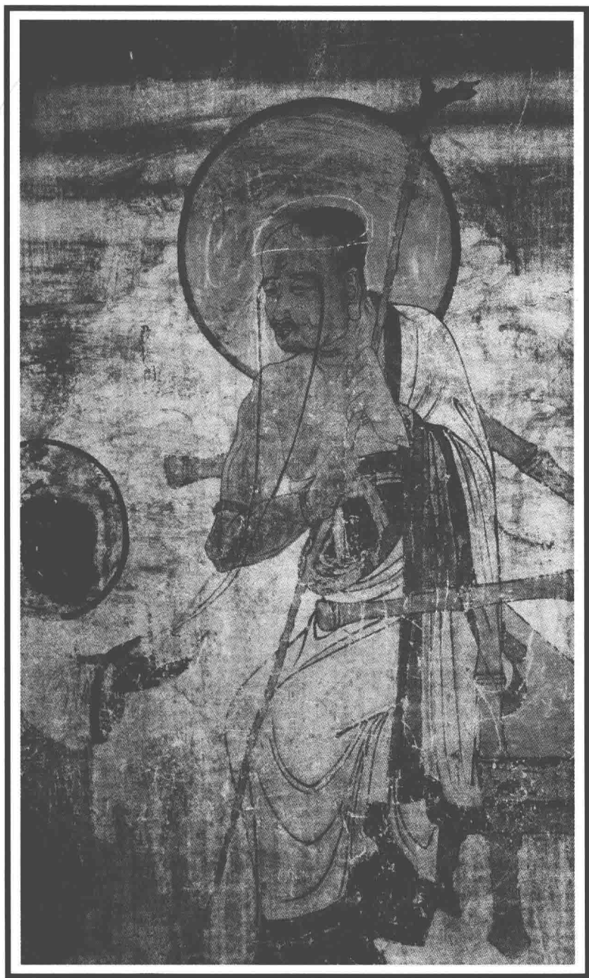
古羅漢壁畫·莫高窟（元朝）