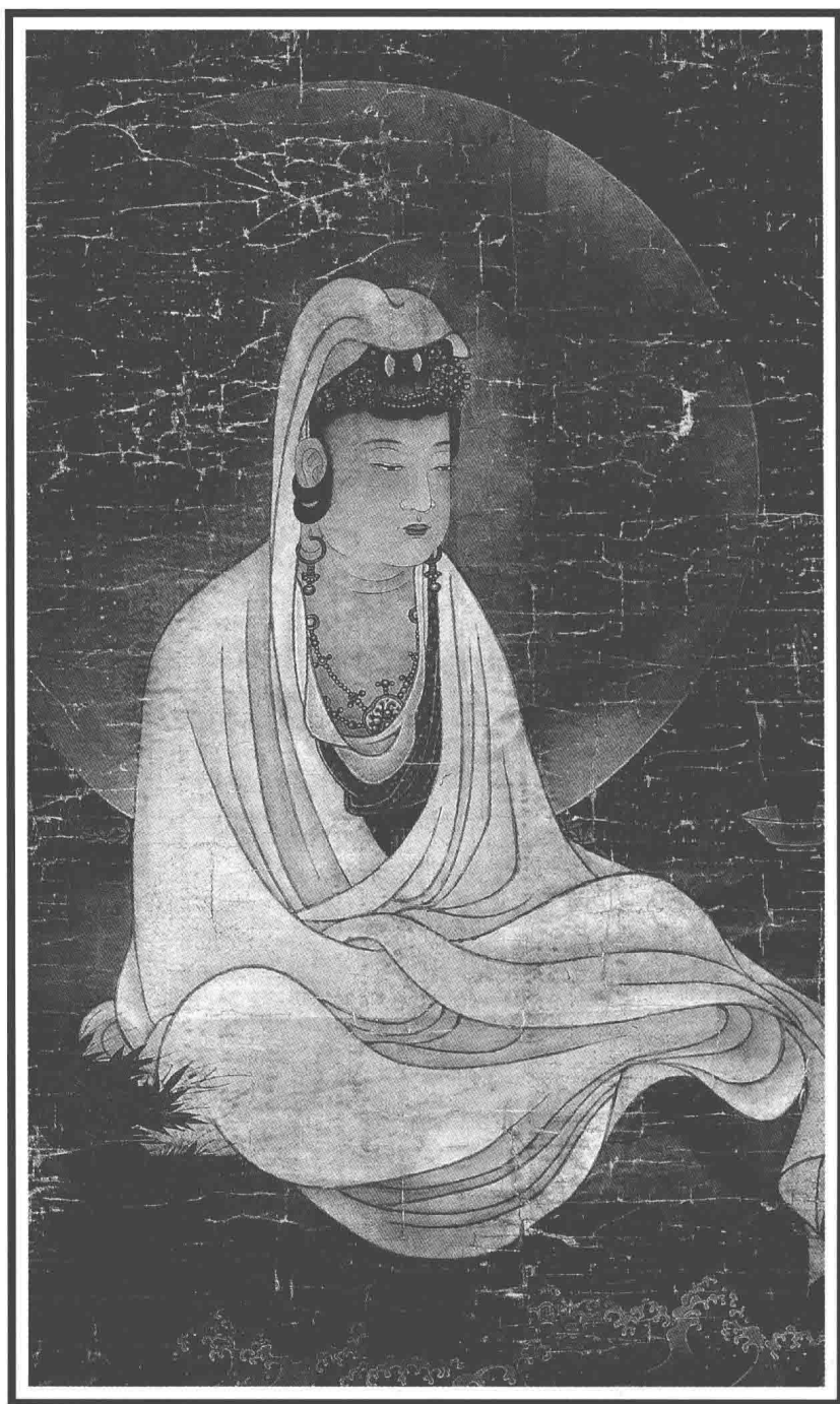
水月觀音圖·工筆畫(明朝)·