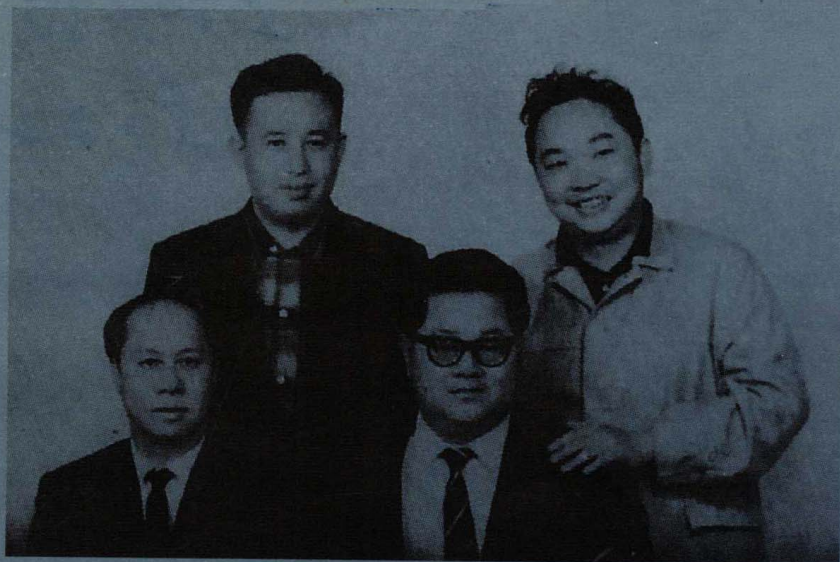
左一 卧龙生,左三 诸葛青云,右一 古龙。