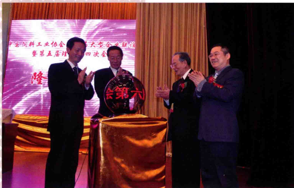
2010年10月17日，在江西省南昌市举办的第六届大型饲料企业联谊会开幕式上，农业部副部长高鸿宾（左2），中国饲料工业协会会长白美清（左3），江西省常委、副省长陈达恒（左1）和正邦集团有限公司总裁林印孙（左4）出席启动仪式。