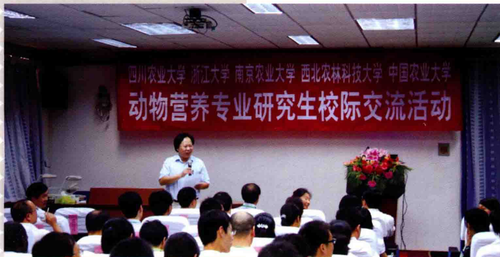
2010年6月24~27日,四川农业大学、浙江大学、南京农业大学、西北农林科技大学、中国农业大学5校动物营养专业研究生校际交流会在北京农业部饲料工业中心召开,近百名研究生参加了为期两天的交流活动。此次交流活动加深了动物营养专业院校之间的交流,扩展了学生的视野。