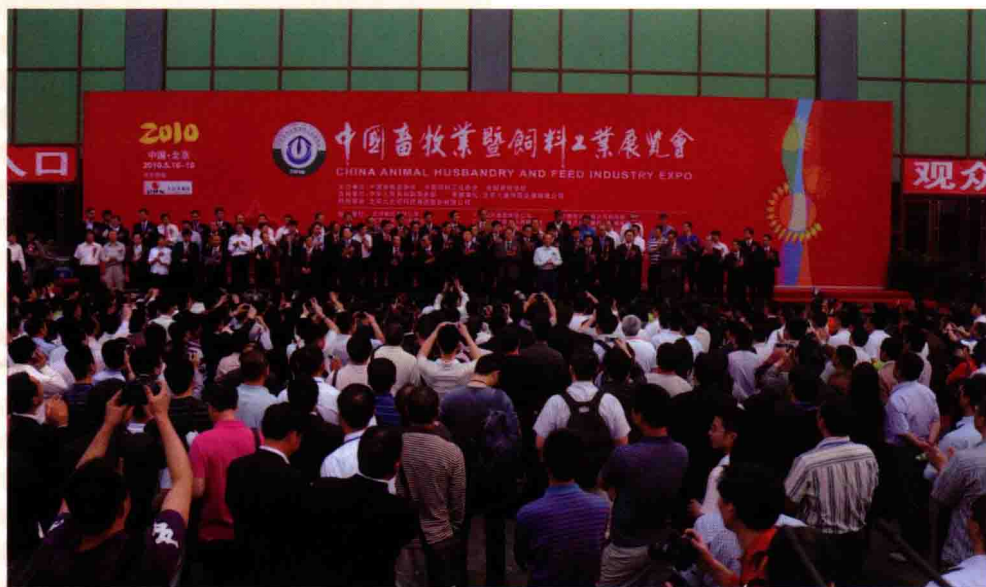
2010年5月16日，由中国畜牧业协会、中国饲料工业协会和全国畜牧总站联合主办的“2010中国畜牧业暨饲料工业展览会”在北京举行。本届展览会广泛收集行业信息以促进产业结构调整和行业资源整合，优化畜牧饲料市场；加强科技知识和先进理念在行业中的宣传，推动新知识、新技术、新成果的普及应用；全面展示企业形象，推广产品品牌；提高国际化水平，大力增进国际交流与合作。