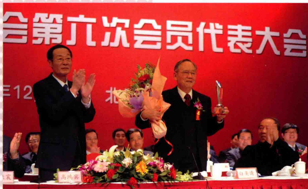
2010年12月13日，在中国饲料工业协会第六次会员代表大会上，中国饲料工业协会第五届理事会会长白美清（左2）获得“中国饲料行业终身贡献奖”，农业部副部长高鸿宾（左1）亲自颁奖。