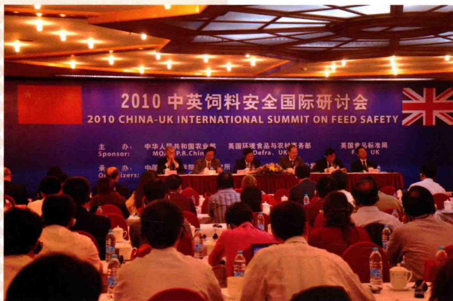
2010年5月15日，2010中英饲料安全国际研讨会在北京举行。此次会议为促进中英两国在饲料质量安全保障及饲料工业可持续发展方面的交流与合作方面起到了积极的作用。