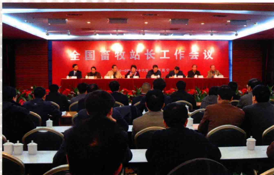
2010年1月16~17日，全国畜牧站长工作会议在广西南宁举行。农业部副部长高鸿宾，全国畜牧总站站长、中国饲料工业协会秘书长谷继承，全国畜牧总站党委书记、副站长、中国饲料工业协会副秘书长何新天及各省、自治区、直辖市、计划单列市、新疆生产建设兵团、黑龙江省农垦总局畜牧、草业、饲料、奶业技术推广部门负责人及新闻媒体单位共165人参加了此次会议。会议的主要任务是贯彻落实中央农村工作会议、全国农业工作会议和全国畜牧兽医工作会议精神，总结2009年畜牧业技术支撑工作取得的成绩和经验，分析面临的形势，部署2010年的工作。