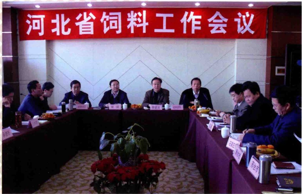
2010年3月10日，河北省饲料工作会议在河北省沧州市召开。会议旨在总结2009年全省饲料工作取得的成绩和存在的问题，并部署2010年的总体工作。