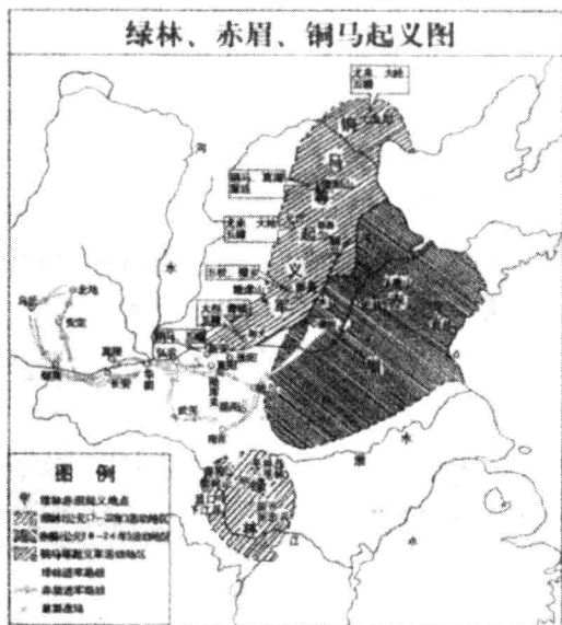
绿林、赤眉、铜马起义图