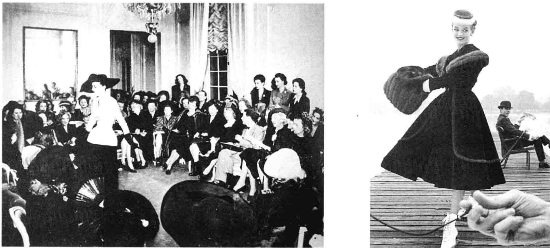
图 1-7 二十世纪四十年代设计师迪奥设计的新样式,其以展现女性传统美为主,因迎合了当时女性的审美需求而引起广泛的流行。

四十年代新样式指 1947 年由设计师迪奥(Dior)设计的以展现女性传统美的“花冠型”服装样式,当时的时尚芭莎主编以 New Look 称之,由此迪奥的花冠型女装与 New look 画上了等号。迪奥的“新样式”流行受当时社会环境的影响:四十年代,第二次世界大战使功能化和制服化的