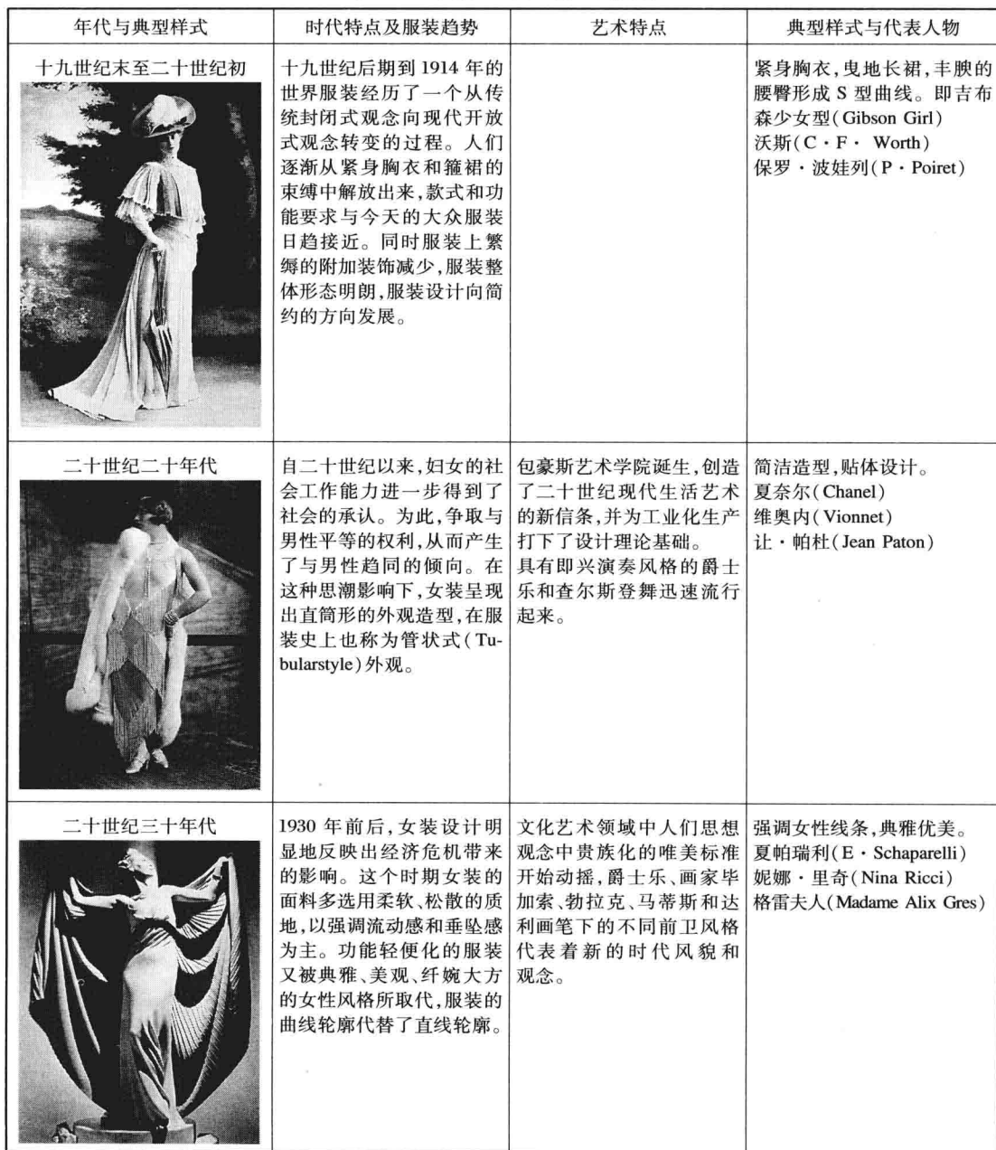
表 1-1 西方二十世纪女装发展

的回归;五十年代生活的丰裕使女装出现休闲化趋向;六十至七十年代受嬉皮朋克文化影响出现的超短裙等系列革新样式;八十年代受女权运动影响的宽肩式T型女装样式;以及九十年代后的女装样式多元化、流行大众化等。为了更好地对西方二十世纪不同时期的生活特征、经济社会、艺术形式以及女装典型样式进行了解,特以表格的形式加以呈现。