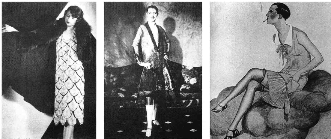
图 1-5 二十世纪二十年代男孩样式,将女性特有的丰胸、束腰、夸臀等特点掩饰起来,追求平胸、松腰、束臀的男孩化外观。

形象特点 女子流行装束追求平胸、松腰、束臀的男孩化形象,配合小而合型的钟型帽。大量的珠串装饰,短发,崇尚消瘦、苗条、青春的身材和艳丽的妆容。