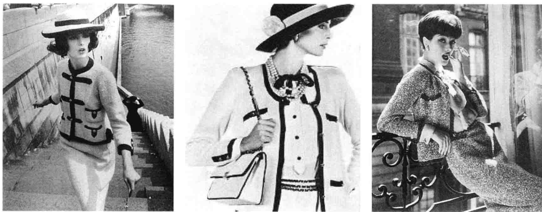
图 1-6 二十世纪二十年代设计师夏奈尔设计的无领对襟外套、及膝裙和内衫组成的 H 型三件套组合样式。

形象特点 追求舒适和美观的着装,配合大量的人造珍珠项链、钟型帽、朝气的短发,得体的妆容,希望藉由服饰传达出“苗条、帅气、简洁、自由”的美学风格,为女性塑造出一种年轻不受拘束的形象。