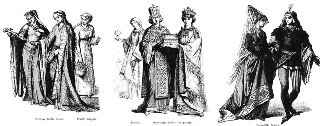
图 1-2 中世纪女装注重造型感,有一定的建筑特征。样式变得较为封闭,浓重的政教色彩赋予服装象征意义和神秘色彩。注重装饰细节和图形的表现。