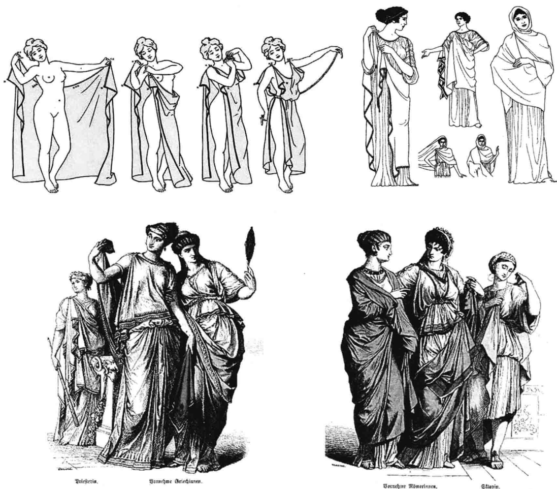
图 1-1 古希腊的希顿, 宽松自由的轮廓、缠绕的结构、流动感的线条、雕塑感的布纹效果, 充分体现女性的自然身躯。