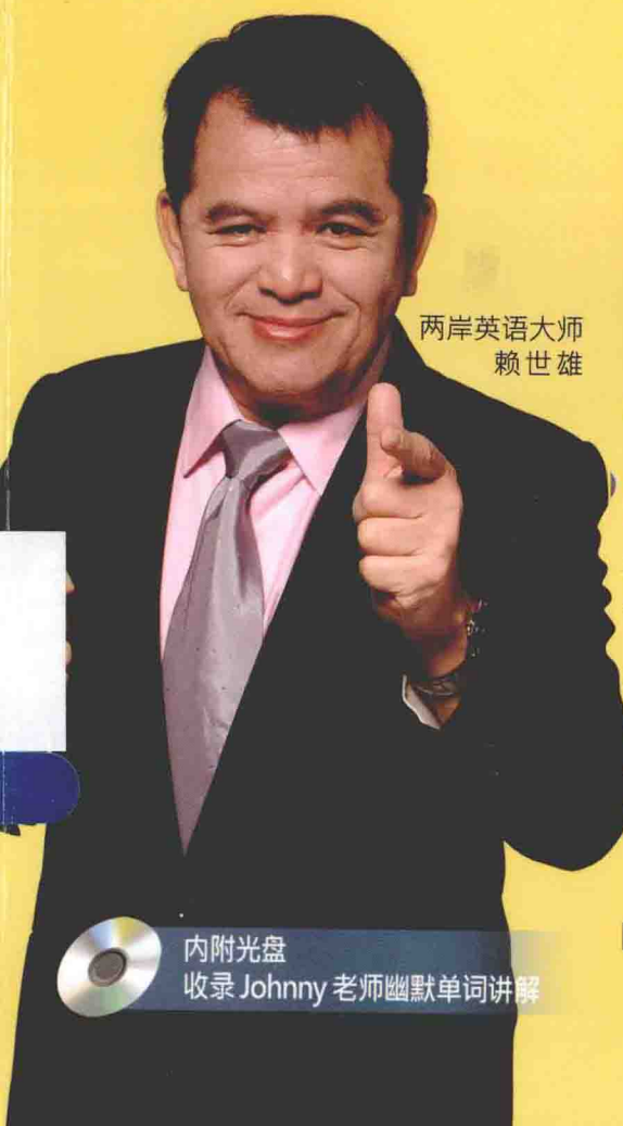
两岸英语大师 赖世雄