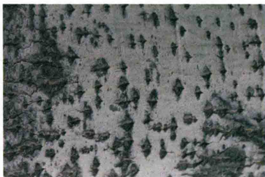
图1-5 自然界中的点（树皮）

点的扩大会产生面的感觉，如图1-6所示，点是一样大的，但由于画框的不同，就会产生不同的视觉感受。